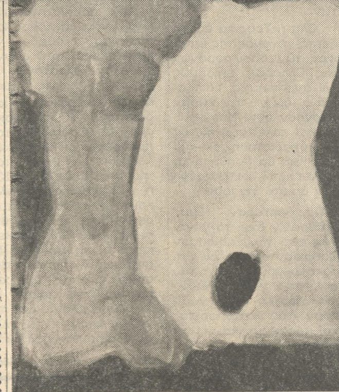
«Μάταλα Νο 10»

διαφορες ομαδικές εκθέσεις. Στην 11η Πανελλήνια Έκθεση 1971 έγραψε (Έφημ. ΒΗΜΑ, 14.5.71) έπαινετικά γι' αυτόν ή Έφη Άνδρεάδη, ενώ μόνιμα εκτίθενται έργα του στην «Νά 16 Άρτ Γκάλερι» στην Άθήνα, όπου διαρκής Έκθεση Έλλήνων ζωγράφων, νάη και λαϊκής τέχνης. Για τίς άγιογραφίες έχουν γράψει: «Ποιός έλεγε τίς άγιογραφίες του και δέν ειπε πώς είναι σάν ποιήματα; Η Κρήτη είχε κάποτε σχολή, τώρα ξαναγεννιόμαστε ζωγράφοι...» Τόν ευχαριστούμε επίσης γι