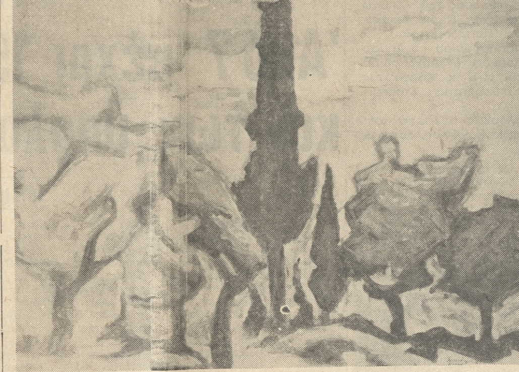
«Τοπίο από τούς Βώρους»

ατί με όλη την καλή του διάθεση παραχώρησε στη στήλη και δού του έργα (τοπίο από τούς Βώρους και Μάταλα), άντιπροσωπευτικά τού καλλιτεχνικού δυναμισμού του μά και όλων των συλλογισμών του στην πρώτη παγκρήτια έκθεση καλών τεχνών στα Χανιά, άν