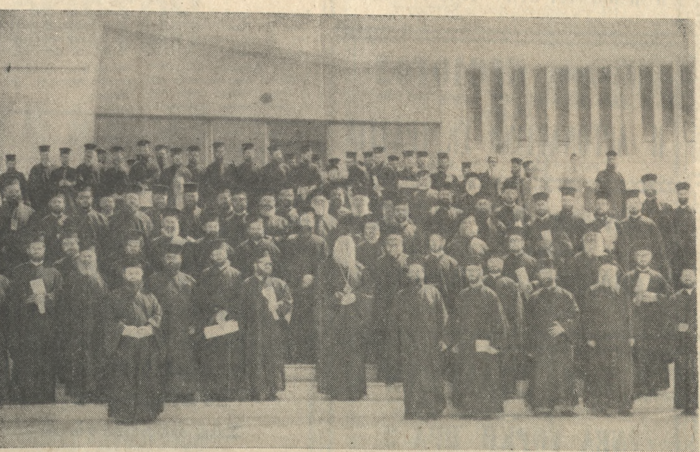
Οι συμμετέχοντες του 19ου Ίερατικού Συνεδρίου Ίερείς τής περιφέρειαι τής Ίεράς Αρχιεπισκοπής Κρήτης φωτογραφούμενοι έξωθεν του Έπανωσήφειου Οικοτροφείου, εις μιαν διακοπήν τών εργασιών του Συνεδρίου. Είς τό μέσον ο Σεβ. Αρχιεπίσκοπος Κρήτης κ. Ευγένιος.