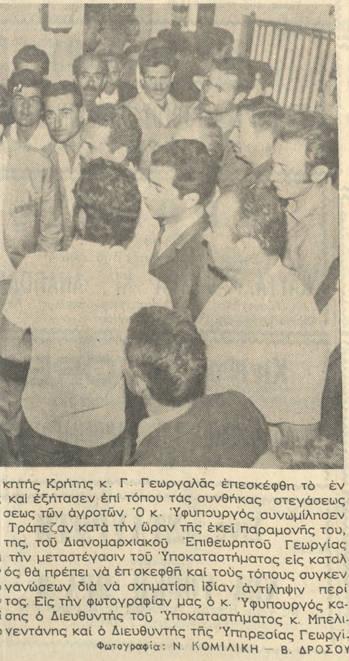
Χθές την πρώτην ό 'Υπουργος Περιφερειακός Διοικητής Κρήτης κ. Γ. Γεωργιάδης έπεσκέφθη τόν έν 'Ηρακλείω 'Υποκατάστημα της 'Αγροτικής Τραπεζής και εζήτησεν επί τούπου τās συνθήκας στεγνάσεως και λειτουργίας του, ως και τόν τρόπον εξυπηρετήσεως τών άγροτών. 'Ο κ. 'Υπουργός συνμίλησεν με πολλούς άνθρώπους, οι όποιοι εύρισκοντο εις την Τράπεζαν κατά την ώραν της εκεί παραμονής του, έν συνεχεία δέν συνεσκέφθη μετά τού Διευθυντού της, τού Διανομαρχιακού 'Επιθεωρητού Γεωργίας και τού Διευθυντού της Γεωργικής 'Υπηρεσίας, διά τήν μεταστέγησιν τού 'Υποκαταστήματος εις καταλλήτερον κτίριον. Φρονούμεν ότι ο κ. 'Υπουργός θα πρέπει να έπσκεφθ και τούς τόπους συγκεντρώσεως σουλτανίας υπό τών Συνεταιριστικών 'Οργανώσεων διά να σχηματίση ίδιαν αντίληψιν περί τού τρόπου παραδόσεως και παραλαβής τού προϊόντος. Εις τήν φωτογραφίαν μας ό κ. 'Υπουργος κατά τήν έπίσκεψίν του εις την ΑΤΕ. Διακρίνονται επίσης ό Διευθυντής τού 'Υποκαταστήματος κ. Μπελιμπασάκης, ό Διανομαρχιακός 'Επιθεωρητής κ. Σερ γεντάνης και ό Διευθυντής της 'Υπηρεσίας Γεωργίας κ. Μπομπολάκης.