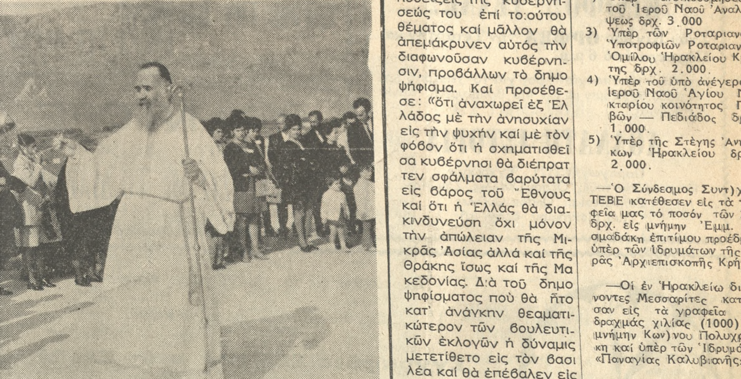
Προχθές Κυριακήν ο Σεβ. 'Αρχιεπίσκοπος Κρήτης κ. Ευγένιος έτέλεσεν, παρουσία πλήθους πλήθους πιστών, τά έγκαίνια τού νεοοδομήτου ιερού ναού τού Άγιου Νικολάου εις τó χωριόν Γάζι Μαλεβυζίου. Ό ναός είναι τρικλήριον και τιμάται έπίσης εις μνήμην Άγ. Γεωργίου και Άγ. Νεκταρίου. Άνωτέρω στίμιοτυπον από τά έν λόγω έγκαίνια.