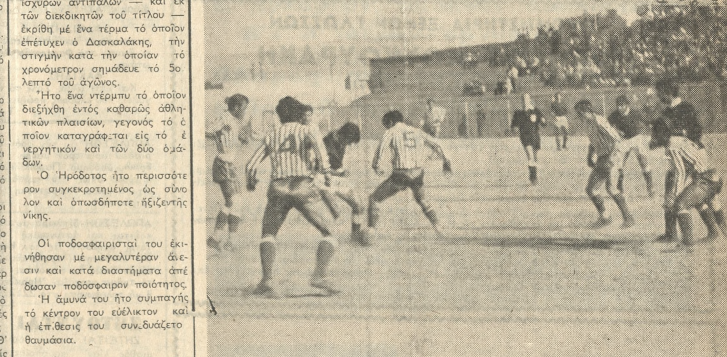
Συνωτισμός είς τά καρέ του 'Ηρωδότη διά νά άπο κρουσθή μία από τας έπιθέσεις του ΠΟΑ.

τό όποιο έσημείωσεν ο 'Αποστολάκης (4') είς όάρος τής ομάδος του. Τό άπροσδόκητον αυτό τέρμα έκαλύδωσεν τους παίκτας της νικητρίδας, ενώ έκανε τους ποδοσφαιριστάς του Ποσειδάων να άπαλέσουν τήν ψυχράν μίαν των καί να μην είναι είς θέσιν να θέσουν ύπό τόν έλεγχόν των τό μάτς. Τόν άγώνα διήρθευε ο κ. Διδινής (καλός). ΕΓΩΝ — ΟΦΙ Οί άντίπαλοι διετήρασαν