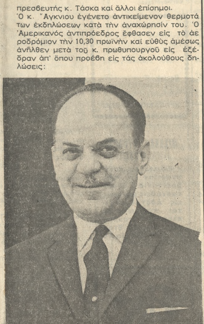
Άποχαιρετισμός τής οικογενείας τής Συνέχεια εις τήν 4ην σελίδα