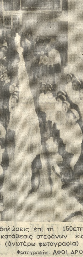
Ήρχισαν χθές εις τήν πόλιν μας και λίγων σήμερον αι εορταστικά εκδηλώσεις επί τή 150ετηρίδι τής Έθνικής Παλιγγενεσίας τού 1821. Χθές τό άπόγευμα έλαβον χώραν κατάθεσις στεφάνων εις τό Μνημείον τού Άγνωστού Στρατιώτου και εις τά άγάλματα Δασκαλογιάννη (άνώτερω φωτογραφία) και Μιχ. Κόρακα.