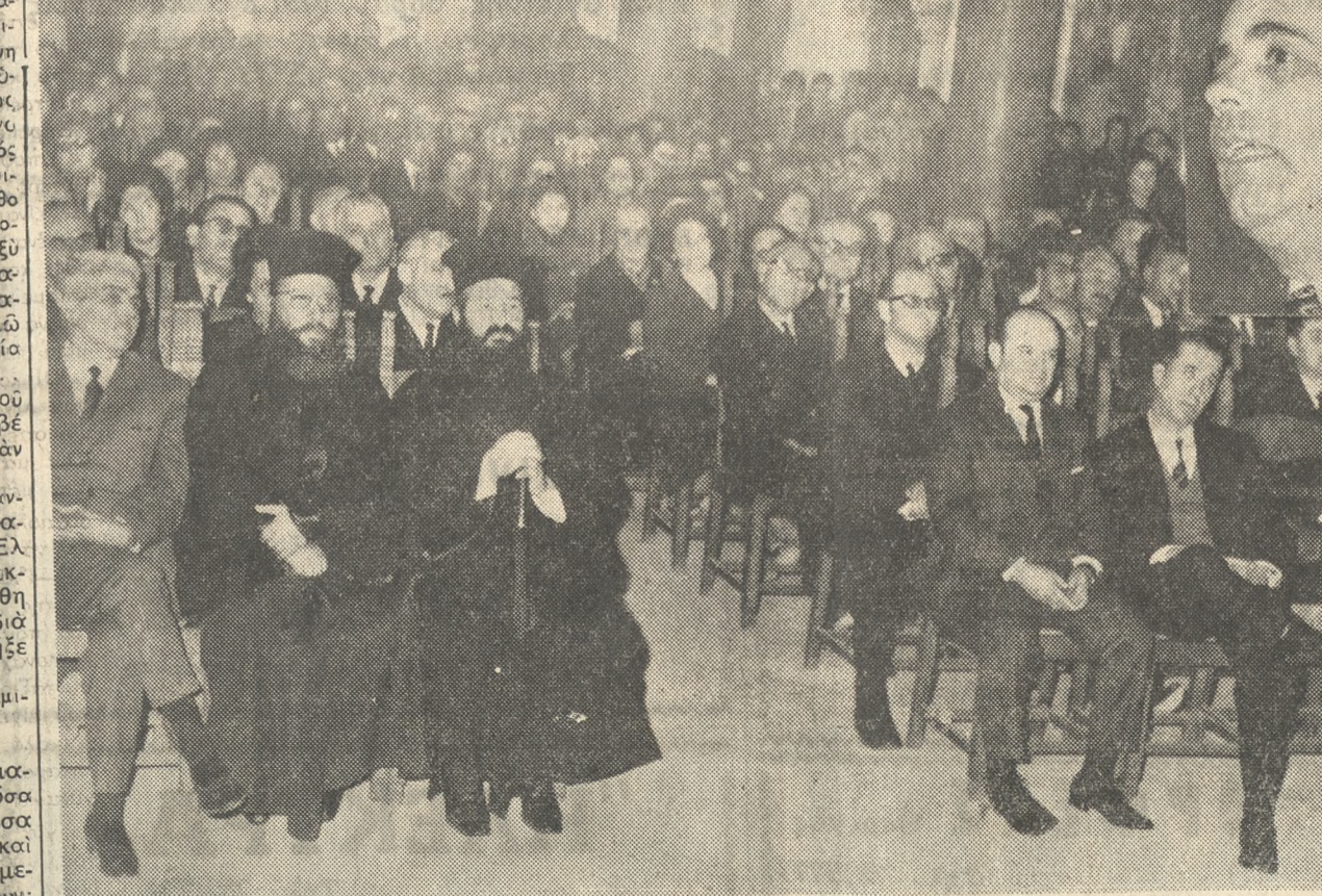
Χθές τήν 7.30 έσπερινήν τήν αίθουσαν τής Βασιλικής του Άγιου Μάρκου έπραγματοποιήθη ή προαγγελθείσα διάλεξις υπό του Εκπαιδευτικού Συμβούλου κ. Κ. Μαλούκου, όστις ανέπτυξεν τό θέμα «Ο πνευματικός άνθρωπος». Η διάλεξις είν οργανωθή υπό τής Ένωσεως Λειτουργών Εκπαιδευσεως και Τό Λογισμικού Συλλόγου Ηρακλείου. Άνωτέρω στήσιον άπό τήν έν λόγω διάλεξιν.