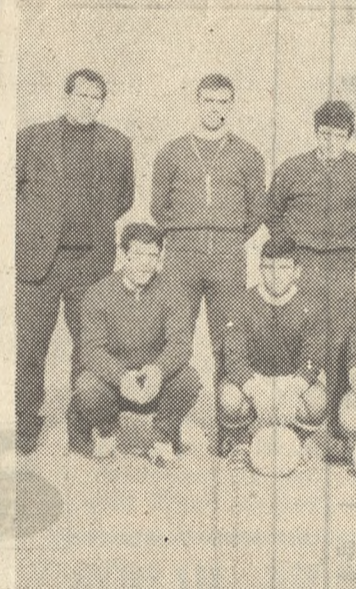
Η δημοφιλής όμάς τού ΠΟΑ φωτογραφουμένη όλίγον πρό τής ενάρξεως τού προχθεσινού άγώνος πρός τόν Ηρακλή.

Οι συνθήκες κατά από τής όποίας διεξήχθη τό μάτς αυτό ήσαν τέτοιες ώστε δέν ύπήρχε άφορμή έκέρδιζεν ό Παναϊτωλικός. Είμεθα, όμως, περίεργοι να πληροφορηθώμεν τί θα έγένετο άν ό άγων συμπεριλαμβανέτο εις τού ΠΟΑ-ΠΟ. Διά έτόλμα δηλαδή να τόν άρχισή 45' ή 40'λόκληρα λεπτά πρό τής κανονικής ενάρξεως τού διοικητή; Νά έτα έρώτημα τό όποι-