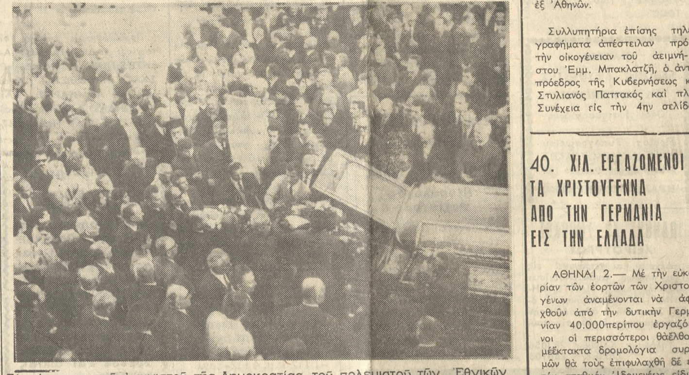
Τό φέρετρόν του άγωνιστού τής Δημοκρατίας, του πολεμιστού τών Έθνικών άγώνων, του γνησίου νόμου τής Κρητικής γής, φέρεται από Χανιώτες προς τήν τελευταίαν του κατοικίαν τήν Κρητικην γήν εν μέσω του πλήθους τών Χανιωτών που τόν συνοδεύουν εις τήν τελευταίαν του έξοδον.

ΜΕΓΑ πλήθος Χανιωτών συνώδευσε χθές εις τήν τελευταίαν του κατοικίαν εις τό νεκροταφείον του άγίου Λουκά τών Χανίων. Τόν νεκρόν τού τέως βουλευτού και αντιπροέδρου τής Βουλής και άγωνιστού τών Έθνικών πολέμων Έμμ. Μπακλατζή, ενώ πλήθος τέως βουλευτών έξ έλλης τής Έλ