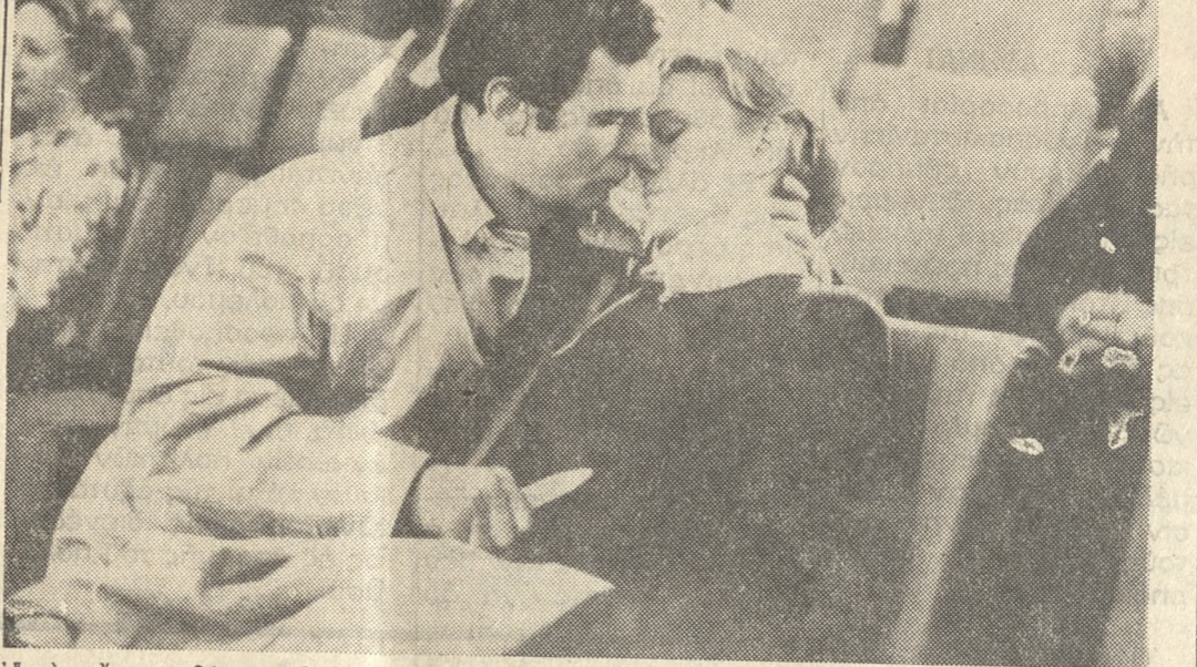
Από αύριον θα προβάλλεται εις τόν κιν)φον «ΑΣΤΟΡΙΑ» ή έγχρωμη Γαλλικής παραγωγής αστυνομική ταινία «ΜΑΙΤΡ ΤΟΥ ΕΓΚΛΗΜΑΤΟΣ». Τό έργον έχει δοθη εις κοσμοπολιτικην άτιμόσησαν, υπάρχει ό έρωσ και τό σέξ, καλά χρώματα, όλα δε όμοιού συνθέτουν ένα ικανοποιητικόν και ευχάριστον θέαμα. Ανωτέρω μία σκηνή από τήν εν λόγω ταινία.

• ΚΑΙ τό ανέκδοτον τής απήλης: 'Η γυναίκα του Τόμ δέν ει να καθόλου όμορφη. Μετάτην ρωτάται ό οδηγός: 'Η κλοπή έγινε διά τό αύ τοκίντην ή διά τά φέρετρα.