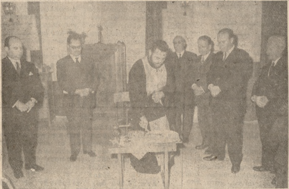
Τὸ ἀπόγευμα τῆς Κυριακῆς ἐκοιτῆ ἡ καθιερωμένη βασιλόπιττα εἰς τὴν αἴθουσαν τῆς Χριστιανικῆς Ἐνώσεως κὸ Ἀπόστολος Παῦλος, παρουσία ἐκπροσώπων τῶν Ἀρχῶν καὶ πολλῶν μελῶν τῆς ἐν λόγω Ἐνώσεως. Τὸ ἀνωτέρω στιγμιότυπον εἶναι ἀπὸ τὴν ἐν λόγω τελετὴν.