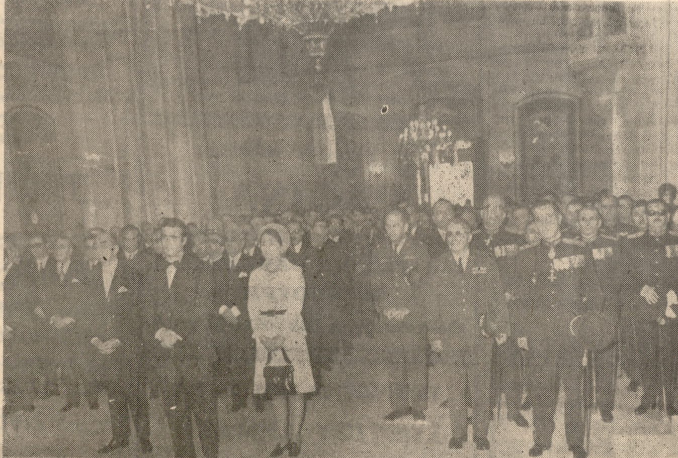
Τήν 10.30 πρωίην τής Πρωτοχρονιάς έτελέσθη, εις τόν Μητροπολι. Ναόν του 'Αγ. Μηνά, έπίσημος Δοξολογία, επί τώ Νέω Έτει, χροστατούτος του Σεβ. Αρχιεπισκόπου κ. Ευγενίου. Εις τήν δοξολογίαν παρέστησαν ό Υφυπουργός καί ή κ. Γεωργιάδ καθώς επίσης καί άπασαι αι Πολιτικά, Στρατιωτικά, Δικαστικά καί λοιπα 'Αρχαί τής πόλεως μας, ως καί πλήθος κόσμου. Άνωτέρω σιτημιότυπον από τήν Δοξολογία.