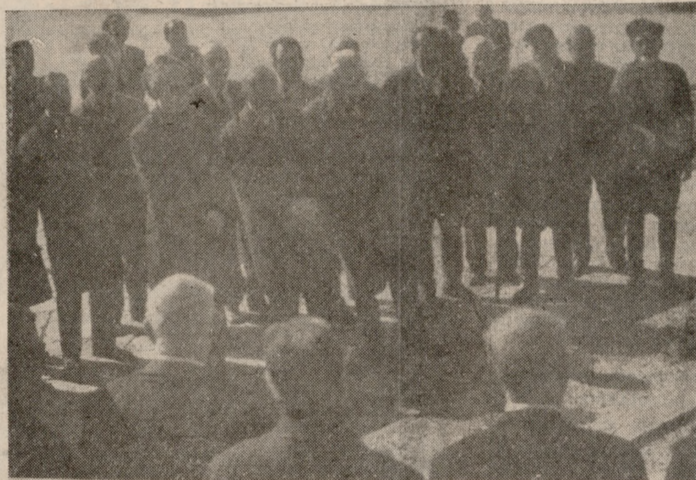
Στιγμιότυπον από το μνημόσυνο

Η ΚΡΗΤΗ έτιμωσε και χθές τους Βενιζέλους με την ευκαιρία της 8ης επέτειου από του θανάτου του αειμνήστου προέδρου Σοφοκλή Βενιζέλου. ΤΟ ΑΚΡΩΤΗΡΙ. Ιερός θωμός της Έλευσεως και των Δημοκρατικών Ίδεωδών, με τους διδύμους τάφους του Έθνάρχου Έλευθερίου Βενιζέλου και του προέδρου Σοφοκλή Βενιζέλου, συνεκέντρωσε και πάλι χθές την προσοχή των άπανταχού Κρητών και έδέχθη την κατάθεση του θαυτάτου σεβασμού και της εὐγνωμοσύνης των σύγχρονων Έλλήνων προς τους με γάλλους νεκρούς του.