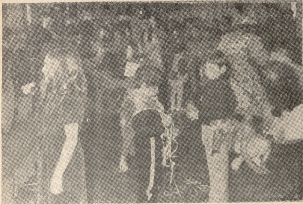
Με παιδικούς χορούς χθες το απόγευμα, και με τον επίσημο χορό των Ροταριανών στο ξενοδοχείο «Ξενία» το βράδυ άνοιξε το αποκριτικό γλέντι στο «Ηράκλειο». Στην φωτογραφία μας οι πρώτοι μικροί μεταμφιεσμένοι στον παιδικό χορό του ξενοδοχείου «Αστρία».