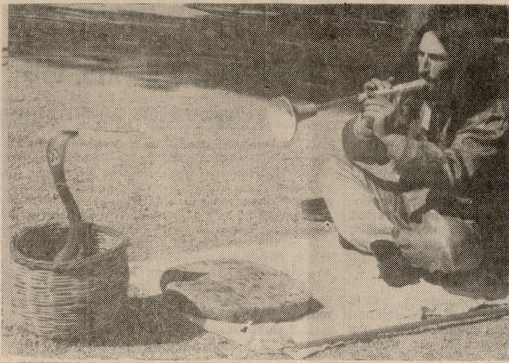
Λέοντες, θοές, πίθωνες, κόμπρες, λεοπαρδαλίες και όλα τα ζώα του βασιλείου της ζουγκλας. Ένα θάμα μοναδικό για τα παιδιά.