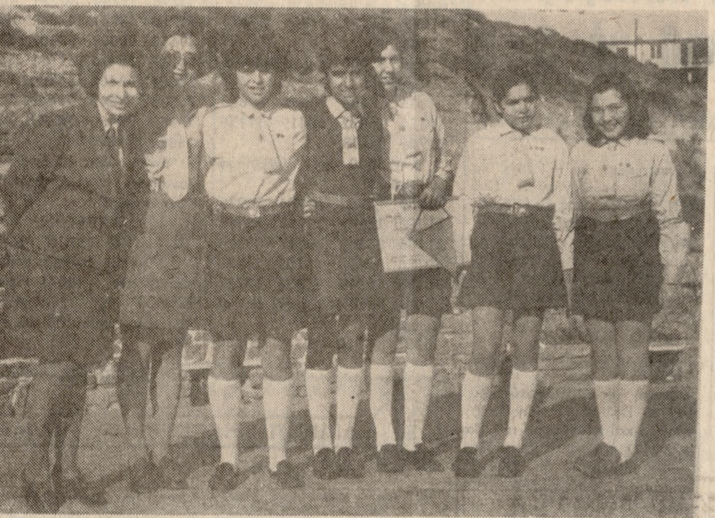
Δύο στιγμιότυπα ἀπὸ τὸ συνέδριον.