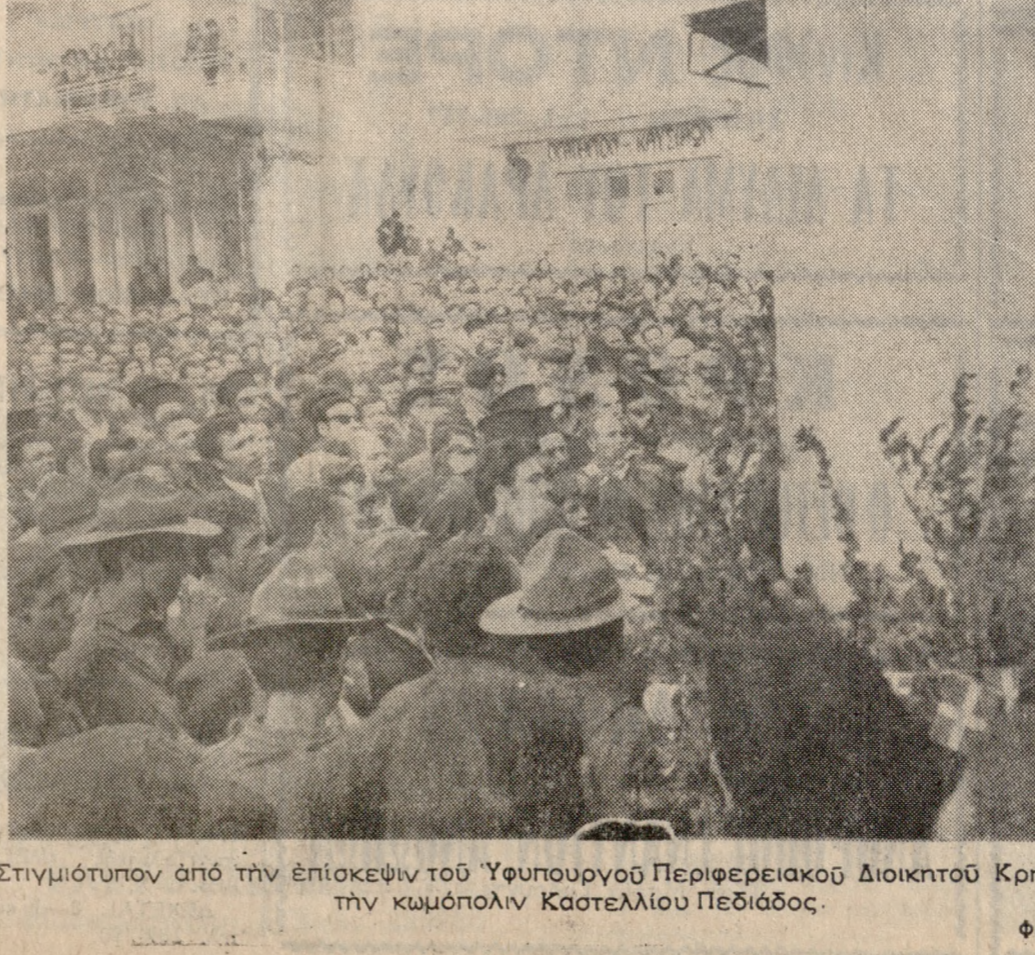
Στιγμιότυπον από τήν έπισκεψήν του Ύφυπουργού Περιφερειακού Διοικητού Κρήτης κ. Γ. Γεωργιάδης εις τήν κομόπολην Καστελλίου Πεδιάδος.

Τήν κομόπολην Καστελλίου πρηνεύσασθαι τής έπαρχίας Πεδιάδος έπισκέψθη χθές ό Ύφυπουργός Περιφερειακών Διοικήσεων τής Κρήτης κ. Γ. Γεωργιάδης, όπου άνεκηρύχθη έπιτιμος δή μότης. Έθουσιώδης ύποδοχή έπε φυλάχθη εις τόν κ. Ύφυπουργόν υπό τών κατοίκων τόνον εις Καστέλλι όσον και εις τας ένδοκίμασιν κοινότητας Κουινάδων, Πελάων, Άγιών Πασσακίων και Άποστόλων εις τας όποιας εστάθμισεν ό κ. Γεωργιάδης και συνάμειψεν μετ' όν τών κατοίκων ήκουσεν τας αιτήματα των και έδωσεν τάς έπι δαλλομένας λύσεις. 'Ο κ. Ύφυπουργός έπεσκέψθη εις Πεζιά τας έγκαταστάσεις του οινολογίου Άφών Μηλιαράκη και τής Ένώσεως Πεζών ή όποια είναι ή μεγαλύτερη και ή πλέον προοδευτική Γεωργική Ένωσις τής Έλλάδος. Εις τό Καστέλλι ό κ. Γεωργιάδης συνάμειψεν μετ' όν τών κατοίκων ήκουσεν τας αιτήματα των και έδωσεν τάς έπι δαλλομένας λύσεις.