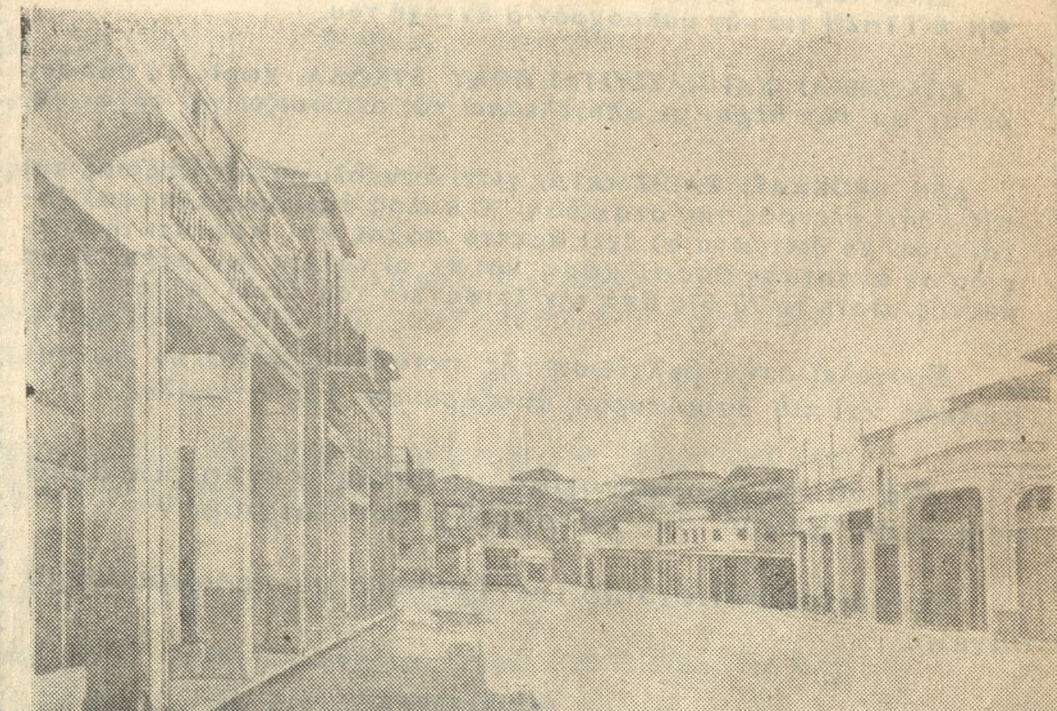
Η πλατεία 23ης Μαρτίου της Καλαμάτας. Άριστερά φαίνεται τό άκίνητον, όπου ειχεν εγκατασταθή ή Τράπεζα Καλαμών κατά τό 1918, εξακολουθούσθν δέ να εύρίσκωνται τά γραφεία του ύποκαταστήματος της σημερινής Τραπεζής Έμπορικής Πίστεως.

ΚΑΤΑ την τελευταίαν αύτην περίοδον ένα εύρύ πρόγραμμα εκσυγχρονισμού των εγκαταστάσεων και βελτιώσεως των μεθόδων εργασίας, κυρίως διά της χρησιμοποίησεως των πλέον εξέλιγμένων μηχανικών μέσων έτέθη εις εφαρμογήν με σκοπόν την αύξησιν άποδόσεως εις την εξυπηρέτησιν της πελατείας.