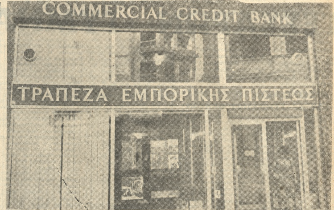
Τό έν Ηρακλείω Ύποκατάστημα της Τραπεζής Έμπορικής Πίστεως του οποίου τά έγκαινία θά τελεσθούν αύριον την 12.30' μεσημβρινήν.

γομένου έτους είχε γίνει αισθητή ή ανάγκη της παρουσίας της εις την πρωτεύουσάν, ή οποία από της λήξεως του πρώτου παγκοσμίου πολέμου και ήδως μετά την μικρασιατικήν καταστροφήν, είχε καταστή τό κέντρον ένός άνευ προηγουμένου οικονομικού και τραπεζικού άρρασιμού.