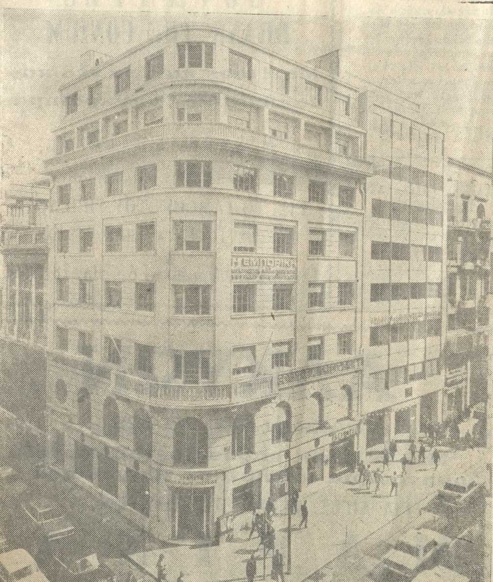
Τό έν Αθήναις Κεντρικόν Κατάστημα της Τραπεζής Έμπορικής Πίστεως (άριστερά έκ των οδών Πεσματζόγλου και Σταδίου)

ΕΙΝΑΙ χαρακτηριστική, μεταξύ άλλων, ή άπασχόλησις του με τά Λουτρά Καϊάφα, τά όποσια ένδοκίονον από τό Δημόσιον διά μίαν είκοσαετιαν, τά έπρόκειτο με ήλεκτρικάς εγκαταστάσεις προφανείως της έποχής των, και έδωκεν ζωήν εις άνεκεμετάλλευτον πλουτοφόρον πηγήν, επί ώφελείας και των πασχόντων και του τό-