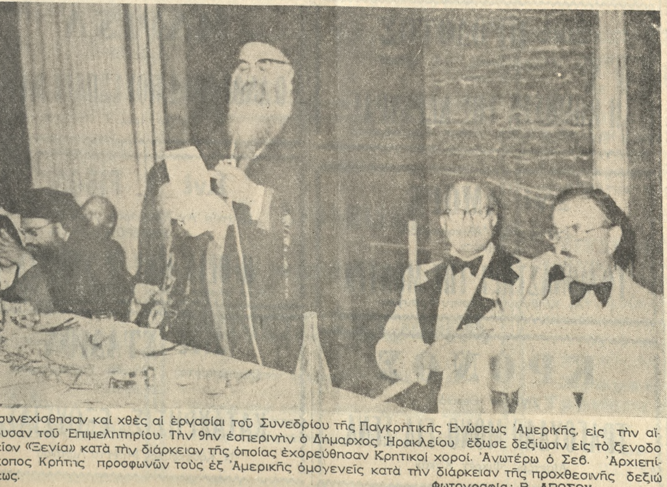
Έσυνεχίσθησαν και χθές αι έργασίαι του Συνεδρίου της Παγκρήτικής Ένώσεως Αμερικής, εις την αίθυσαν του Έπιμελητηρίου. Την 9ην έσπερινήν ό Δήμαρχος Ηρακλείου έδωσε δεξίωσιν εις τό ξενοδόκοπος Κρήτης προσφώνων τούς εξ Αμερικής όμogeneous κατά την διάρκεια της προχθεσινής δεξιώσεως.