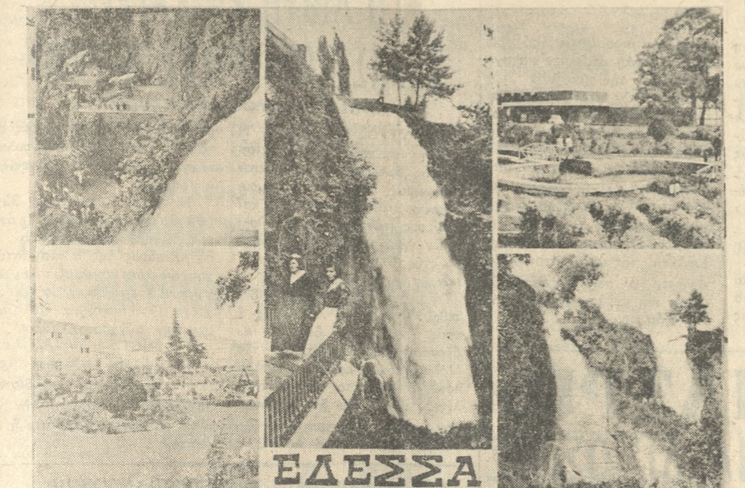
Ἐδεσσα. Καταρράκτες καὶ παράρκα

ἀεροπλάνο. Ἐπιφανήματα χαράς βγαίνουν ἀπὸ τὰ κελιά μας, δὲν ἀντέχομε στὸν πειρασμό. Κάνομε λιγώλεπτη στάση παίρνομε φωτογραφίες, ἀναπνεύομε βαθειὰ ἀπολαμβάνομε. Καὶ σκεπτόμαστε πόσο δίκιο ἔχουν τὸ Κράτος καὶ ὁ Ε.Ο.Τ. ποὺ ἀπέφασαν τὴν τουριστικὴ ἀξιοποίηση τῆς Χαλκιδικῆς μετὰ τὴς ἀπαράμιλλης ὁμορφίης τῆς.