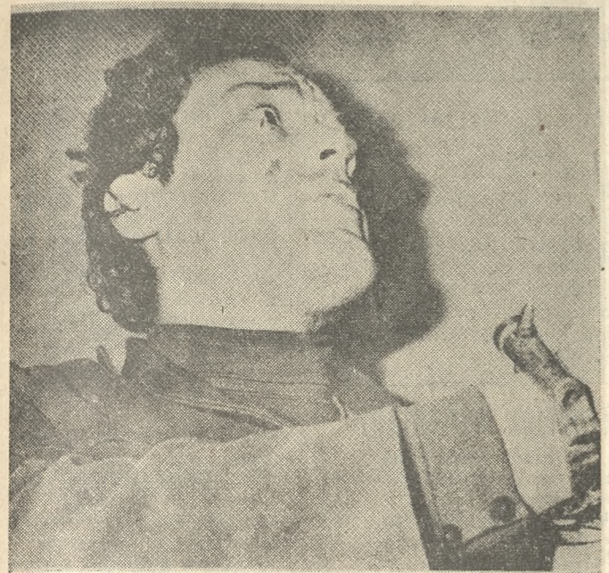
Β. ΛΥΜΠΕΡΗΣ: Τό έγκλημά του εθεωρήθη ως έξω των δεδομένων της Ελλάδος.