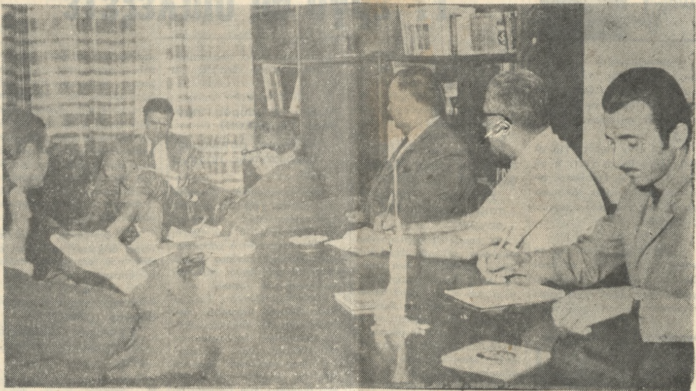
ΣΤΙΓΜΙΟΤΥΠΟΝ ΑΠΟ ΤΗΝ ΧΘΕΣΙΝΗΝ ΕΠΙΣΚΕΨΗΝ ΤΩΝ ΔΗΜΟΣΙΟΓΡΑΦΩΝ ΗΡΑΚΛΕΙΟΥ ΕΙΣ ΤΟΝ ΥΦΥΠΟΥΡΓΟΝ ΠΕΡΙΦΕΡΕΙΑΚΟΝ ΔΙΟΙΚΗΤΗΝ ΚΡΗΤΗΣ κ. Γ. ΓΕΩΡΓΑΛΑΣ.

Η σημερινή διαδικασία ήρξατο την 8.30 πρωινή με τάς απόλογιας των κατηγορουμένων Χρυσανθόπουλου και Μανωλάκη. Έν συνεχεία ήγώρευσε ο Β. Έπίτροπος κ. Ν. Κολοδής ο οποίος έχαρη κτήρισε τους κατηγορουμένους ως άνθρώπους χωρίς πολιτικών υπόθετων την δε όργανωσιν ως άκρας εξτρεμιστικήν είχε προτείνει δε να επιβληθούπο να εις μέν τόν Μανιόν κάθειρξιν 17 έτων εις τόν Σαγιαόν κάθειρξιν 15 έτων εις τόν Χρυσανθόπουλον 14 έτων και εις τόν Μανωλάκη 4 έτων και 4 μηνών.