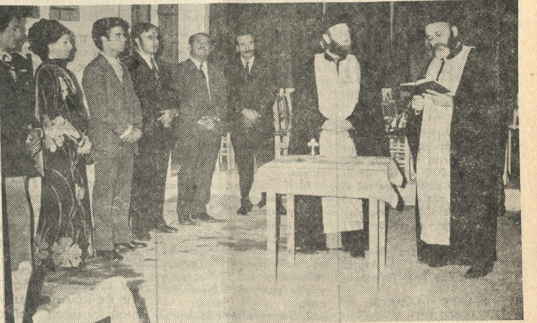
Ἐνα στιγμιότυπο ἀπὸ τὰ ἐγκαίνια τοῦ κέντρου «Ντελίνα» πού ἔγιναν τὸ ἀπόγευμα τοῦ περασμένου Σαββάτου.