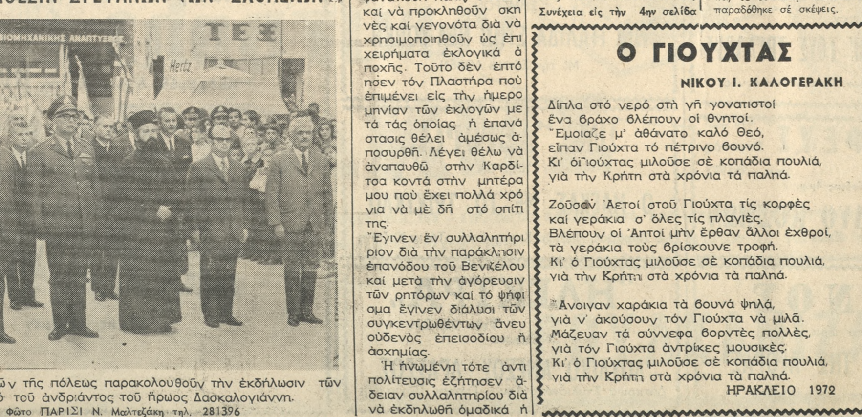
Οι εκπρόσωποι τών Άρχων τής πόλεωσ παρακολουθούσ τών εκδηλώσεων τών Σχολείων τής πόλεωσ πρό τών άνδριάντωσ τού ήρωοσ Δασκαλογιάννη. Φωτό ΠΑΡΙΣΙ Ν. Μαλιτζάκη τηλ. 281396