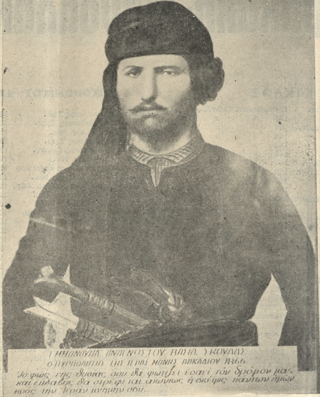
ΕΜΜΑΝΟΥΗΛ ΠΗΛΙΟΥΣ ΤΟΥ ΒΗΛΙΑ ΞΚΟΥΛΑΔΑ... Ο ΠΥΡΠΟΛΗΤΗΣ ΤΩΝ ΠΥΡΗ ΜΟΝΗΣ ΑΡΚΑΔΙΟΥ 1866.