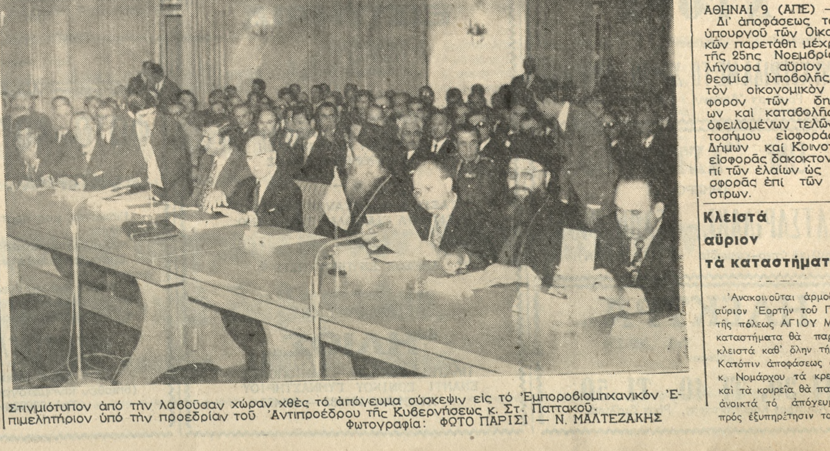
Στιγμιότυπον από τήν λαβούσαν χώραν χθές τό άπόγευμα σύσκεψιν εις τό Έμποροβιομηχανικόν Έπιμελητήριον υπό τήν προεδρίαν του Αντιπρόεδρου τής Κυβερνήσεως κ. Στ. Παττακού.