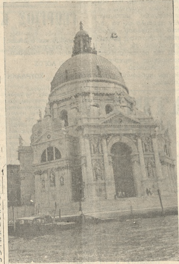
Η Παναγία «ΝΤΕΛΑ ΣΑΛΟ ΤΕ» όπου φυλλάσσεται η ιερά εικόνα της «Παναγίας Μεσοπαντισίας».

Ιατρός καρδιολόγος Διέκτωρ 'Ιατρικής Πανεπιστημίου Άθηνών. 'Ιατρείον: όδός 1821 άρ. 38 α' όροφος Τηλ. 221807 τηλ. οικίας 280.185 *Όραϊ έπισκέψωμεν 5-8 μ.μ.