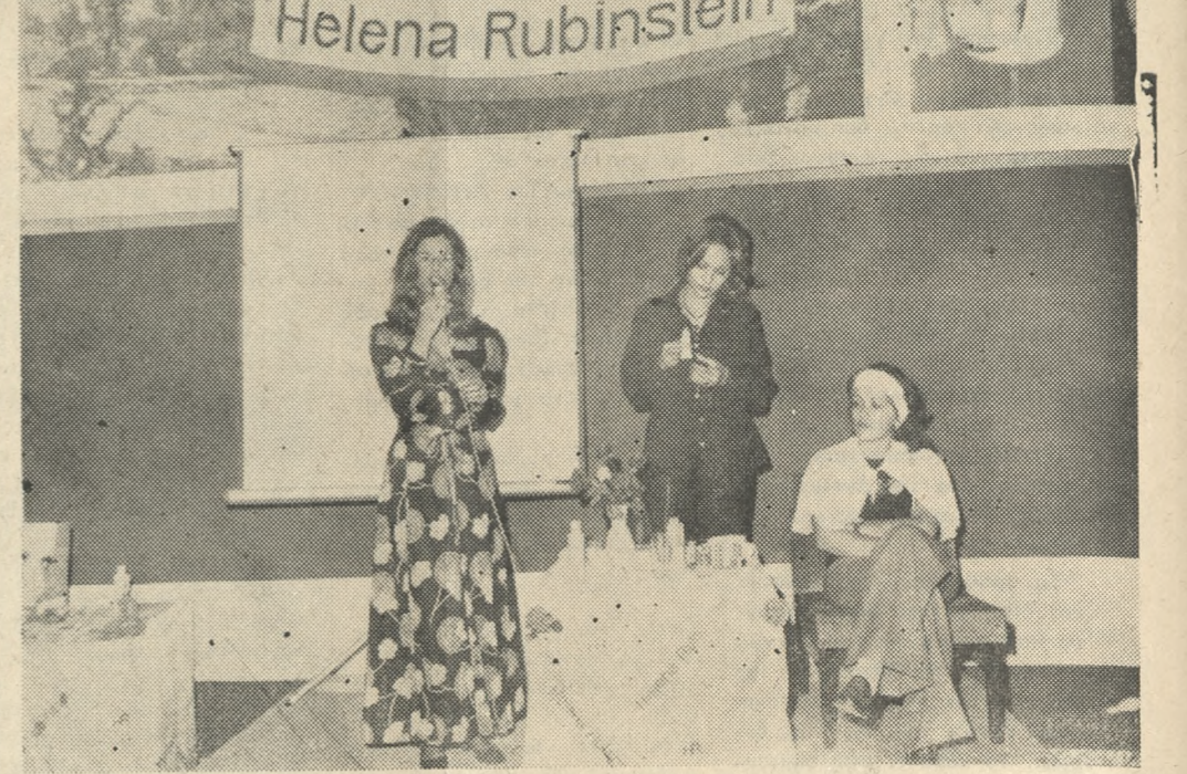
Χθές το ἑσπέρας εις τὸ ξενοδοχεῖον «ΑΤΛΑΝΤΙΣ» ἐνώπιον πολυπληθῶν ἐκ προσώπων τοῦ ὄρους φύλου ἐγένετο ἐπίδειξις καλλυντικῶν καὶ εἰδῶν μακιγιάζ προϊόντων τοῦ Διεθνούς οἴκου «HELENA RUBINSTEIN»