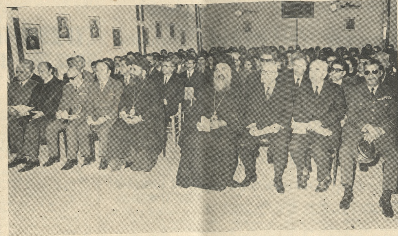
Φωτογραφικόν στιγμιότυπον από την χθεσινή τελετή της Παιδαγωγικής 'Ακαδημίας, κατά την διάρκειά της οποίας ώρκίσθησαν οι πρωτοτείες σπουδασταί αυτής.