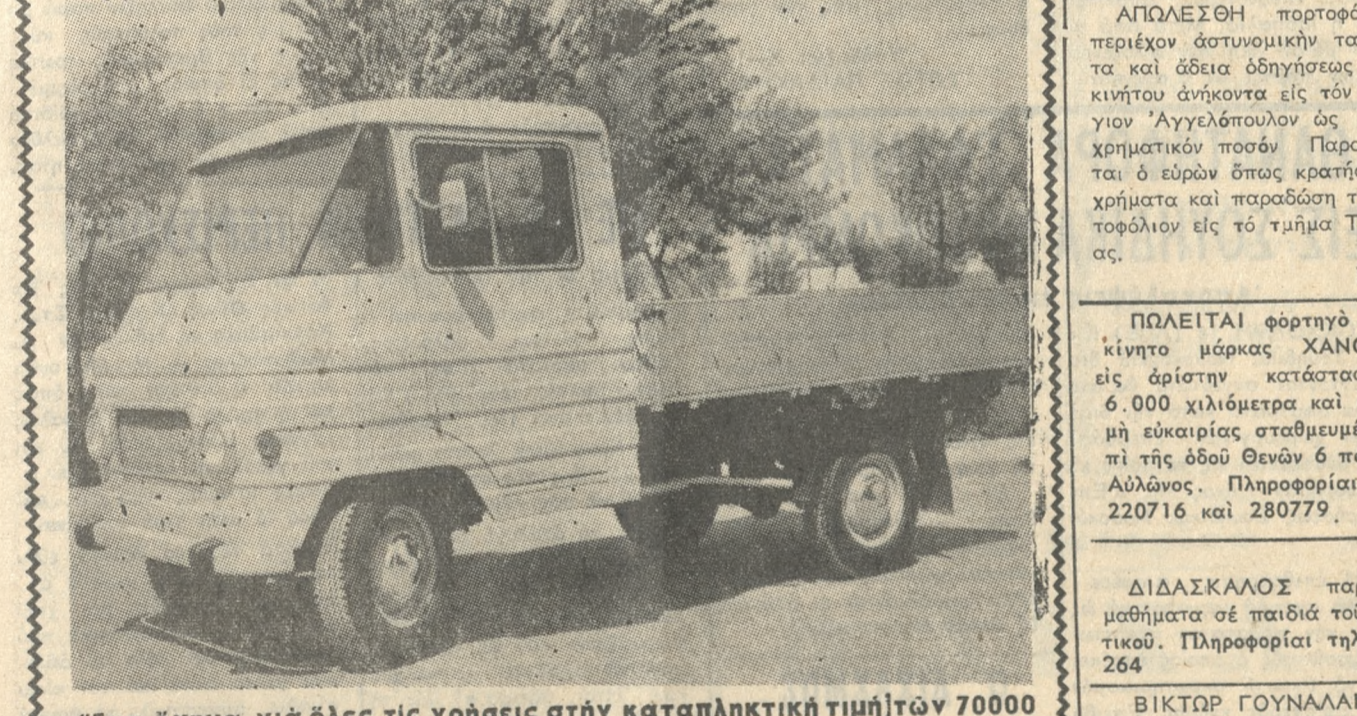
"Ένα ὄχημα γιὰ ὅλες τῆς χρήσεις στὴν καταπληκτικὴν τιμὴν 70000