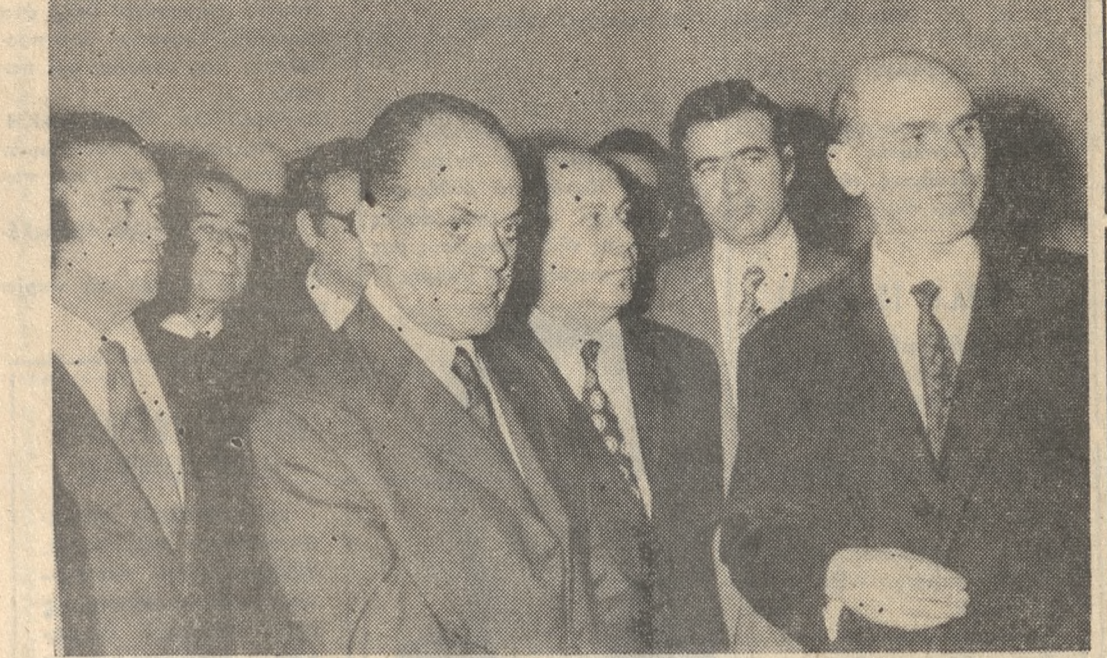
Ο πρωθυπουργός κ. Γ. Παπαδόπουλος κατά την έπισκέφην του χθές εις τό Μουσείον Ήρακλείου.

Έπεσεκέφη Κνωσόν, Μουσείον και ΣΕΑΠ Την 4-30 απογευματινήν χθές άνεχώρησαν άεροπορικώς ες Ήρακλείον, έπιστρέφον εις "Αθήνας ε Πρωθυπουργός κ. Γ. Παπαδόπουλος και οι συνοδούσες αυτόν Άντιπρόεδροι, ε ύπουργός Άνακληρωτής Έσωτερικών και ε Περιφερειακός Διοικητής Κρήτης έπεδήσαν ελι κότεργου και άνεχώρησαν διά τόν "Άγιον Νικόλαον."