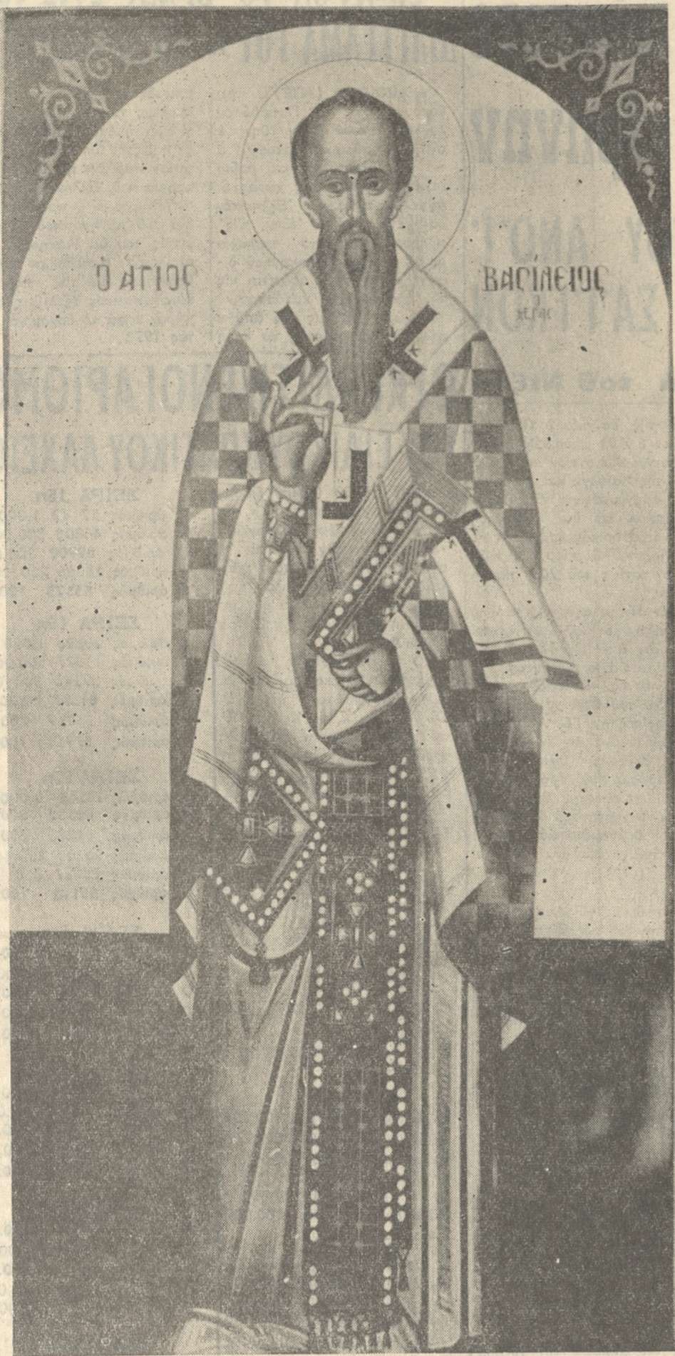
Φωτογραφία από τό έργον του ιερέως άγιογράφου κ. Γεωργίου Μανουσάκη