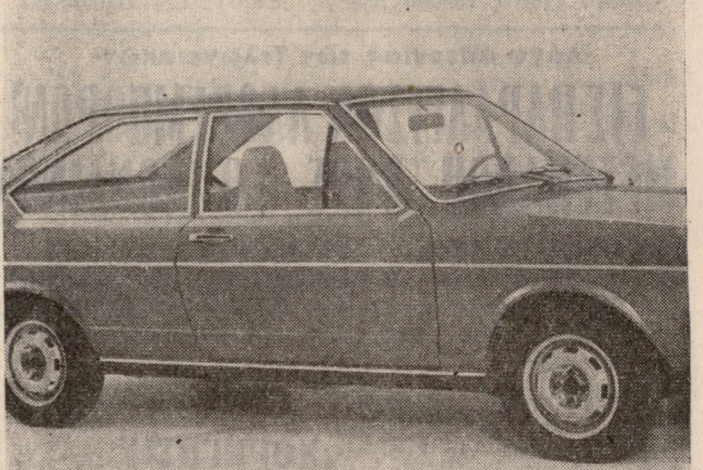
Αυτό είναι τό καινούργιο μοντέλλο Φόλκσβάνγκεν: τό «ΕΑ 400».

•Η ΚΑΙΝΟΥΡΓΙΑ Φάρμουλα 1 «312-Β3» τῆς Φεράρρι είναι έτοιμη και θα δοκιμασθί άπ' τόν Τζάκω Ίξ και τόν Άρτούρο Μερταόριο στην πίστα «Κουάλα» τῆς Νάτιου Άφρικής. Έξ' στον ή δοκιμή άποδείχθί έπιτυχής ή καινούργια Φεράρρι θα ντεμπούταρη έπίση