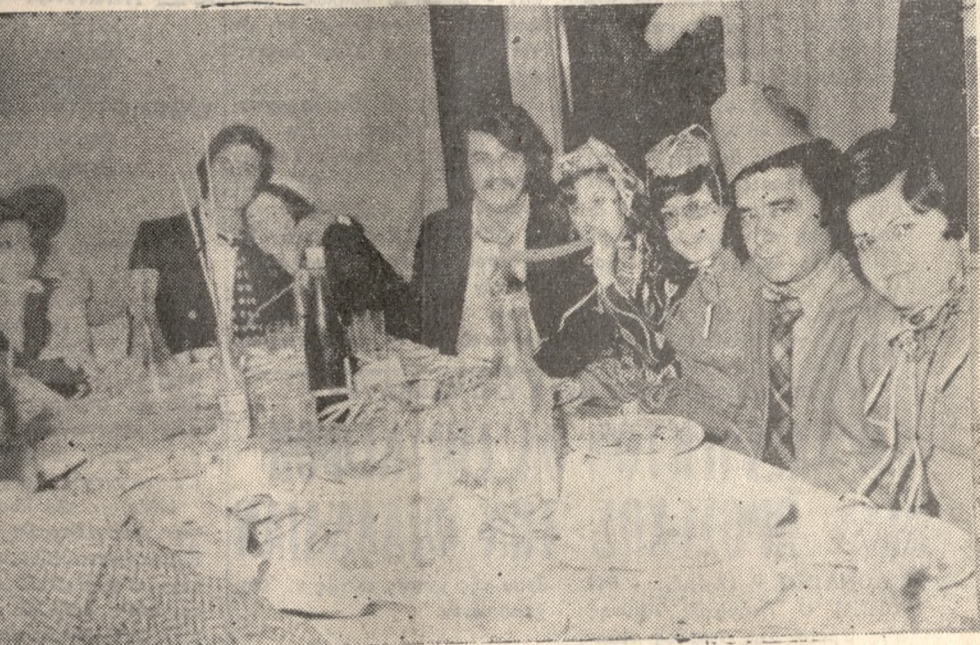
Οἱ φωτογραφίες μας εἶναι ἀπὸ τὸν ἀποκρητικὸν χορὸν πού ἔδωσαν ἢ συμπάθη τὰς τῶν φωτογράφων Ἡρακλείου σὲ κέντρον διασκεδάσεως. Συνεργάτες κ' αὐτοὶ καί μας, εἰς τὴν μεγάλην προσπάθειαν τοῦ κοινού, συμβάλλουν με τὸν φακό τους εἰς τὸ νὰ κάνουν ἐναργέστερα τὰ γεγονότα.

ΕΝΟΙΚΙΑΖΕΤΑΙ εἰς νεόδμητον οἰκοδομῆν ἐπὶ τῆς Λεωφορ. Βασιλῆς Κωνσταντίνου 41 (ἐναντὶ Δικαστηρίου) ὁ τέταρτος τελευταῖος ὄροφος (δύοκλῆρος ὁ ὄροφος ἔνας χώρος) κατὰλληλος διὰ γραφεῖα ἢ ἐπαγγελματικὴν στέγην κ.λπ. Πληροφορία τηλ. 285492 1-6