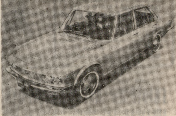
ΑΥΤΟ ΕΙΝΑΙ ΤΟ ΜΑΖΝΤΑ «1800» ΠΟΥ ΑΠΟΤΕΛΕΙ ΤΗΝ «ΝΑΥΑΡΧΙΔΑ» ΤΗΣ ΕΤΑΙΡΕΙΑΣ

Σήμερον παραστάσεις από ώρα 4 ΤΟ ΠΙΟ ΓΡΗΓΟΡΟ ΜΠΟΥΖΟΥΚΙ ΤΑΣΟΣ ΓΙΑΝΝΟΠΟΥΛΟΣ, ΛΙΖΑ ΑΛΕΞΙΟΥ