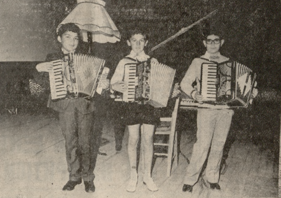
Έπιτυχία έσημείωσε τό πρωτ'ής Κυριακής ή μαθητική συναυλία την όποια ώργάνωσε ό Μουσικός Σύλλογος «Απόλλων» στην αίθουσα του κινηματογράφου (ΝΤΟΡΕ). Στην φωτογραφία μας τρεις από τούς νεαρούς του 'Όδειου ένω έκτελούν ένα μουσικό κομμάτι τής άκκορντεόν.

ΙΔ. ΤΕΧΝΙΚΑΙ ΣΧΟΛΑΙ «Ο ΙΚΑΡΟΣ» ΗΡΑΚΛΕΙΟΝ — ΚΡΗΤΗΣ