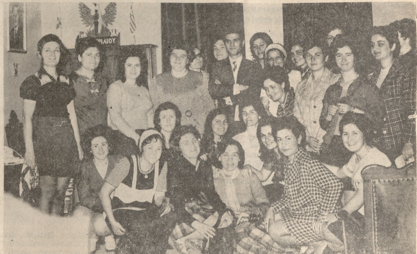
Μεταεκπαιδευόμενα στελέχη του Έθνικου Όργανισμού Προνοίας, άρχηγοί των κατά τόπους (Σπιτιών Παιδιού) τό όποια πραγματοποιούν εκπαιδευτικήν έκδρομήν, έπεσκέφθησαν χθές τον Νομάρχη Ηρακλείου κ. Σωτήριον Μασούρον. Κατά την δοθείσαν δεξίωσιν ο κ. Νομάρχης ένημέρωσεν τας τριάκοντα έπισκεπτάρις του, άναφερθείς εις τήν έν γένει κατάστασιν της πόλεως και του Νομού, εις τήν λαμπράν ιστορίαν του τόπου και εις τό συντελούμενον υπό της Έθνικής Κυβερνήσεως αναπτυξιακόν έργον.

χώρον του Λιβάνου, άναφέρουν ένταυθα καλώς πληροφορημέ ναι πηγαι. Έν τώ μεταξύ η κυβέρνησις του Λιβάνου άπεφάσισε σήμερον να καταθέσει προσφυγήν εις τόν Συμβούλιον Ασφαλείας του ΟΗΕ εναντίον του Ισραηλ διά τήν χθεσινήν έπιδρομήν. Έξ άλλου ο ύπουργός των έξωτερικών του Λιβάνου κ. Καχιλ Αμπουχαμάν, ήλθεν εις έσπαρήν σήμερον την πρωινήν μετά των πρεσβευτών των μεγάλων δυνάμεων και των άμερικανών χωρών διά να εξεστήσει μ' αυτών την εκ της Ισραηλινής έπιθέσεως δημιουργηθείσαν κατάστασιν.