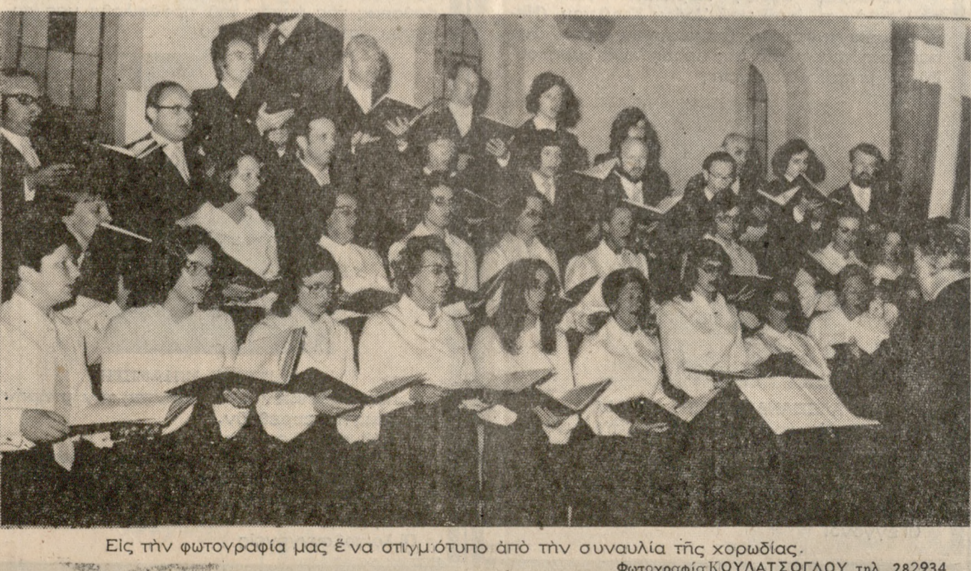
Εις την φωτογραφία μας είνα στιγμιότυπο από την συναυλία της χορωδίας.