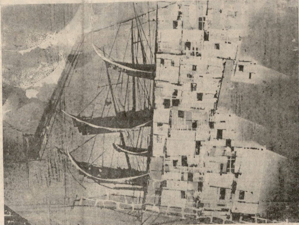
Μιά σημαντικὴ αἰθουσα ἐκ θέσεων ἀποκτᾶ ἡ Κρήτη. Κοντὰ στὸν 'Αγιο Νικόλαο, στὴν Ἀκτὴ Ἐλούντα πρόκειται νὰ

ἐγκαταστήσῃ τὴν Κυριακὴν 15 τρ. ἐκθεσίς τοῦ γνωστοῦ χαράκτου καὶ καθηγητοῦ τῆς Ἀνωτάτης Σχολῆς Καλῶν Τεχνῶν Κωνσταντίνου Γραμματοπούλου.