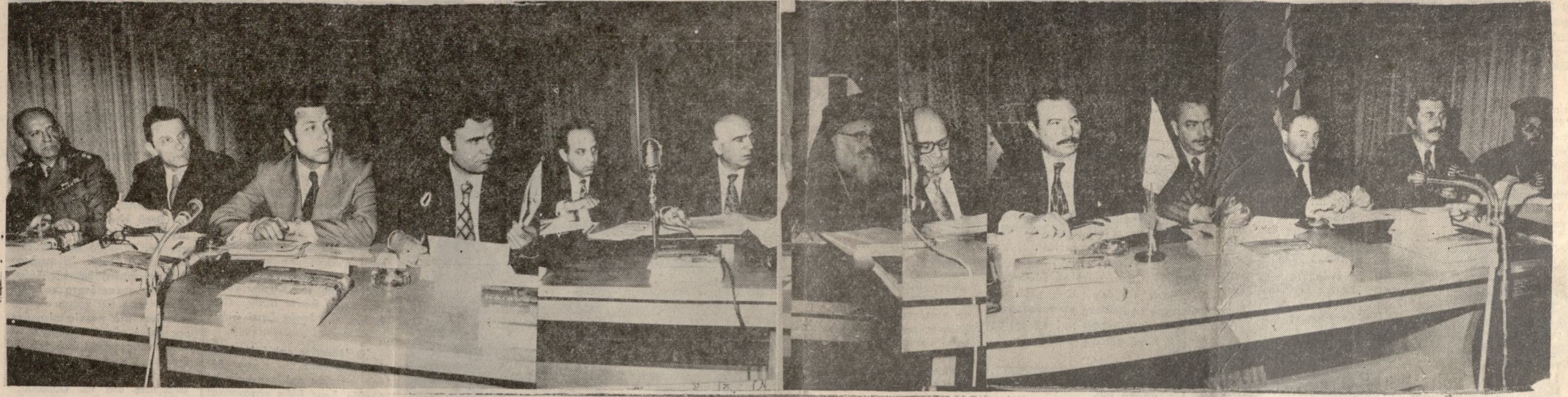
Φωτογραφικόν στιγμιότυπον από την λαθούσαν χώραν χθές ούσκεψιν εις τόν Έμπορικόν και Βιομηχανικόν Έπιμελητήριον τής πόλεως μας. Δακρίνονται έξ άριστερών πρός τά δεξιά: Ο Διοικητής τής 5ης Μεραρχίας Ύποστράτηγος κ. Μπερτσιώδης, ο Γενικός Γραμματεύς Άθλητισμού κ. Βλαδίμηρος, ο Γενικός Γραμματεύς τού Ύπουργείου Δημοσίων Έργων κ. Μπότσης, ο Ύφυπουργός Περιφερειακός Διοικητής Κρήτης κ. Γεωργιάδης, ο Ύφυπουργός Ναυτιλίας, Μεταφορών και Έπικοινωνιών κ. Παπαδογιάννης, ο Α΄ Αντιπρόεδρος κ. Παπακόκος, ο Σεβ. Αρχιεπίσκοπος κ. Εγγύνης, ο Β΄ Αντιπρόεδρος κ. Μακαρέζος, ο Αναπληρωτής Ύπουργός Έθνικής Οικονομίας κ. Καρούδας, ο εκπρόσωπος τής Γραμματείας τού κ. Πρωθυπουργού, ο Γενικός Γραμματεύς τού Ύπουργείου Πολιτισμού και Έπιστημών κ. Σκαρμνηράκης, ο Γενικός Έπιθ. Διοικήσεως κ. Κουκουριδής και ο Σεβ. Μητροπολίτης κ. Τιμόθεος. Η φωτογραφία έλήθη υπό τού καλλιτέχνου φωτογράφου κ. Κουλάτσουλου.

ΣΥΝΕΧΙΖΕΤΑΙ Η ΕΡΕΥΝΑ ΔΙΑ ΤΗΝ ΕΚΡΗΞΙΝ ΕΙΣ ΑΘΗΝΑΣ Αζήτητον τό πώμα τού Ιορδανού ΑΘΗΝΑΙ 14 (ΑΠΕ) Δέν έσημείωσαν πρόδοον άπό συνεχιζομένης και σήμερα υπό τής Γενικής Άσφαλείας Άθηνών, άνακρίσεις πρός πλήρη διαλεύκανσιν τής ύποθέσεως τής προχθεσινής εκρήξεως εις τό Ξενοδοχείον «ΑΡΙΣΤΕΙΔΗΣ» επί τής οδού Σακράτους 50, συνεπεία τής όποιας, έφανευθη ό Ιορδανός Μάσα Άχιάμντ Άμπου Ζεάντ. Έν τώ μεταξύ τό πώμα τού Ιορδανού εξακολουθεί νά παραμένει άζήτητον εις τό νεκροταφείον όπου εφύρισται. Οί εκπρόσωποι τού έν Άθηναις προξενείου τής Ιορδανίας, έρωτηθέντες, ούδέν ένδια- φέρον εδεδήλωσαν διά τήν παραλαβήν τού πτώματος, ήδη δέ ένήμερόν τήν έλληνικόν προξενείον τής Ιορδανίας διά νά άνακτήσῃ τυχόν συγγενείς τού φουθενόντος Ιορδανού και νά διαπιστώσῃ εάν ύφίσταται εκ μέρους αούτων έν διαφέρειον διά τήν παραλαβήν τού πτώματος. Κατά δημοσιογραφικές πληροφορίες, εις τό νεκροταφείον Άθηνών, εγένετο χθές τηλεφώνημα από άγνωστον άτομον τό όποιον εήτησε πληροφορίας, διά τήν άπαιτουμένην διαδικασίαν πρός παραλαβήν τού πτώματος τού Ιορδανού.