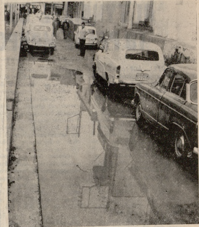
Η άλλοτε οδός Μαυρολένης και τώρα νότιο τμήμα της πλατείας Κορνάρου πλημμυρίζει από την βροχή και γίνεται κανάλι αδιάδοτο. Στην φωτογραφία μας ή κατάστασις τής όδοϋ Μαυρολένης χθές.