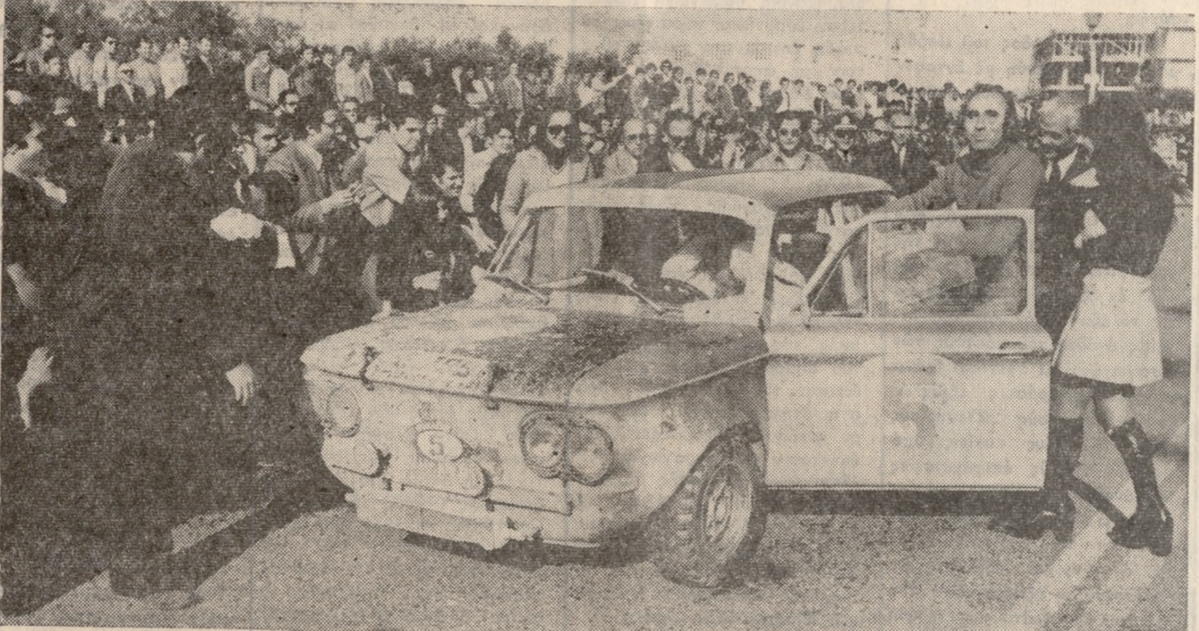
Οι δεσποινίδες της ΣΕΛΛ «λουζουν» μέ ασπανάκια τόν πρώτο νικητή Π. Γαγάνη.