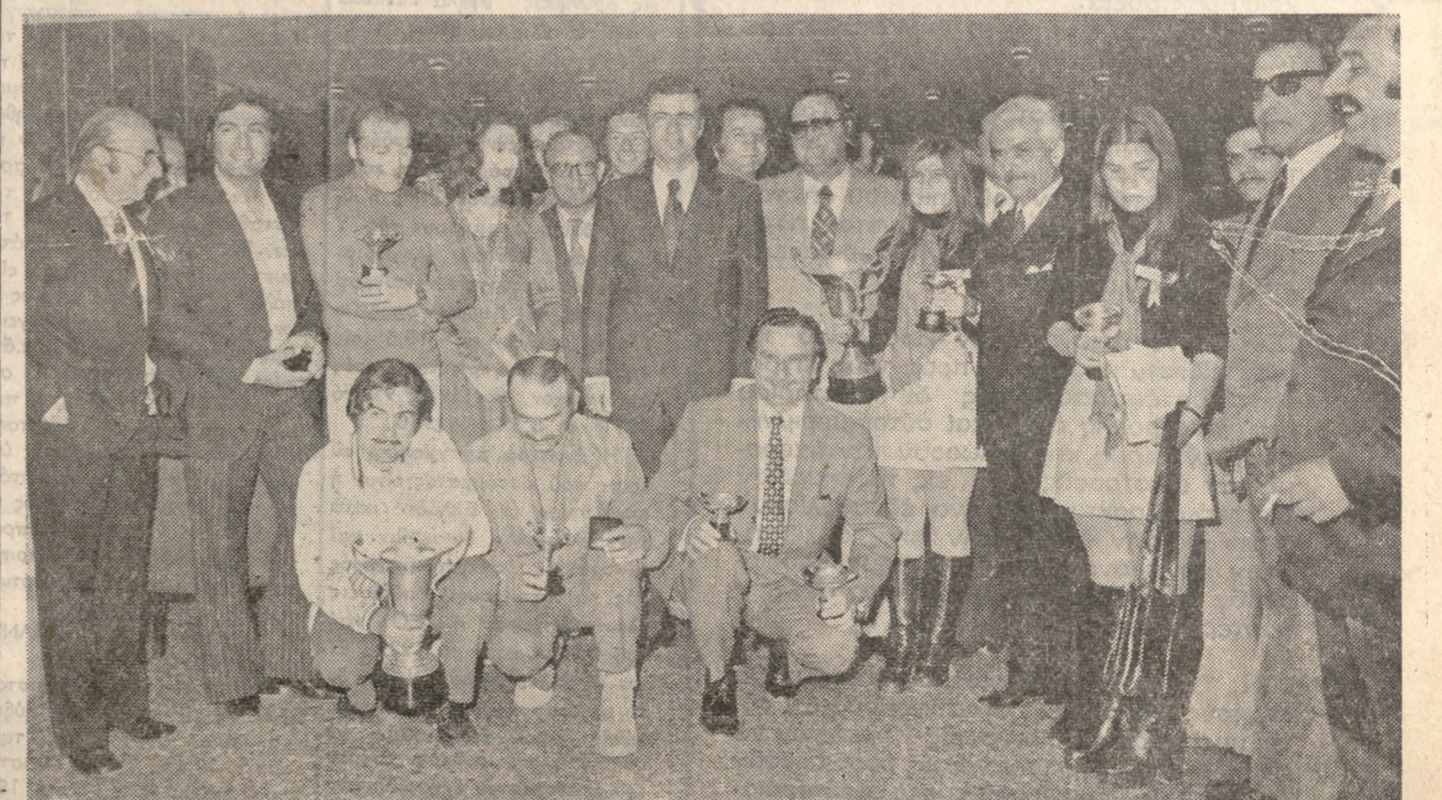
Οι νικηταί του Β' Ράλλυ «Κνωσός» φωτογραφούμενοι μέ τόν Ύφυπουργόν ΠΔΚ και τήν κ. Γεωργιάδη, τόν Δήμαρχον κ. Πετράκη κ. ά.