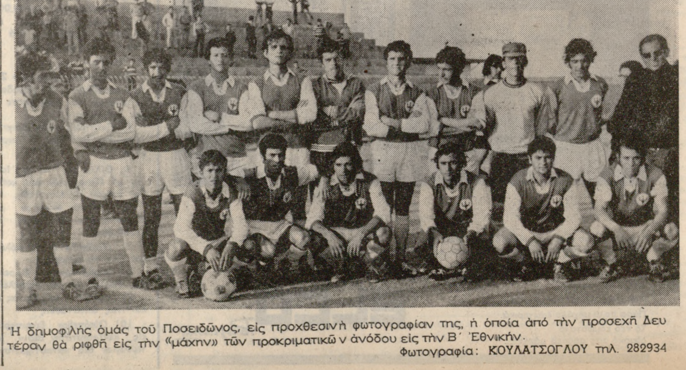
Ἡ δημοφιλὴς ὁμάδα τοῦ Ποσειδῶνος, εἰς προχθεσινὴν φωτογραφίαν τῆς, ἡ ὁποία ἀπὸ τὴν προσεχῆ Δευτέραν θὰ ριφθῆ εἰς τὴν μάχην τῶν προκριματικῶν ἀνοδοῦ εἰς τὴν Β' Ἐθνικῆν.

μετῶν μετὰ διπλώματος. Ἡ ΟΜΑΣ τῆς Α.Ε. ΖΕΚΤΕ κατόπιν ἀράσις ἐμφανίσας ἐπέδωκε τὴν Κυριακὴν εἰς τὸ Ρέθυμνον, τοῦ τοπικοῦ Ἄρεως.