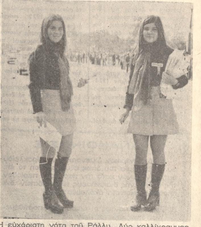
Η ευχάριστη νότα του Ράλλυ. Δύο καλλιγράμμες κοπέλλες μέ τά χρώματα της ΣΕΛΛ, οι όποιες μοίραζαν εντύπους οδηγίνας εις τούς οδηγούς τών πάσης φύσεως τροχοφόρων τά όποια διήρχοντο εκ του χώρου τερματισμού.