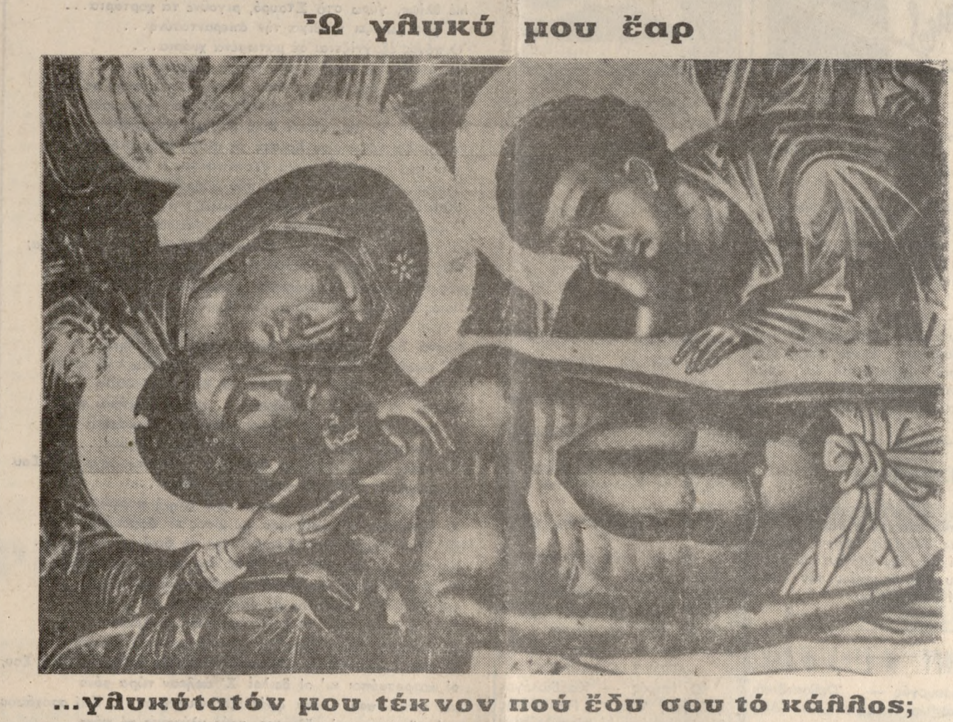
...γλυκυτάτον μου τέκνον που έδου σου τό κάλλιος;

Ο προδότης, ή άπείσιος Ιδιότητα του... Ιστορική άναγκαιότητα. Έτσι έπρεπε να γίνει. Να βρικοει κάποιος στό χώρο ή κατάρτα. Να θυθίζονται άπάντα τό τά θέλη τής άγνης. Ένας στόχος που κι ύστερα άπ' τήν άποκηθλώση του Στανρωμένου, αύτός δε στέκει στό χώρο στο δικό του πετρολόχομένο βάθρο. Υστερα κι άπ' τήν άνάσταση, κι άπ' τήν άύτοτιμωρία του άπήγξατο». Πως να δει τό βρόχο στο λαμό το προδότη. Άρκει; Δέν άρκει τό ότι ό ίδιος τωμάρει με άσπληρότητα τήν πρέ