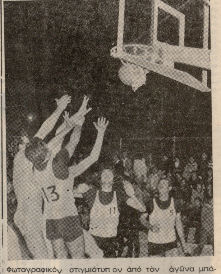
Φωτογραφικόν στιγμιότυπον από τόν αγώνα μάκαετ ΟΑΗ - Έργοτέλους (65-31) ο οποίος διεξήχθη προχθές τό δράδου εις τό γήπεδον τής Οργανώσεως Άντισφαίρισεως (Τένις).