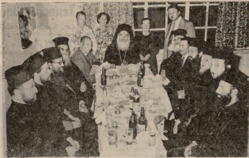
Χθές εορτήν τής Ζωοδόχου Πηγής εώρτασε ό φερώνυμος Ιερός Ναός Χρυσόπηγης. Τής θείας λειτουργίας πρόεδροι ό Σεβ. Αρχιεπίσκοπος Κρήτης κ. Εύ γενίος. Στην φωτογραφία μας ό Σεβ. Αρχιεπίσκοπος κ. Εύγενίος εν μέσω Κληρικών και Έκκλησιαστικών Επιτρόπων μετά τήν θείαν λειτουργίαν.