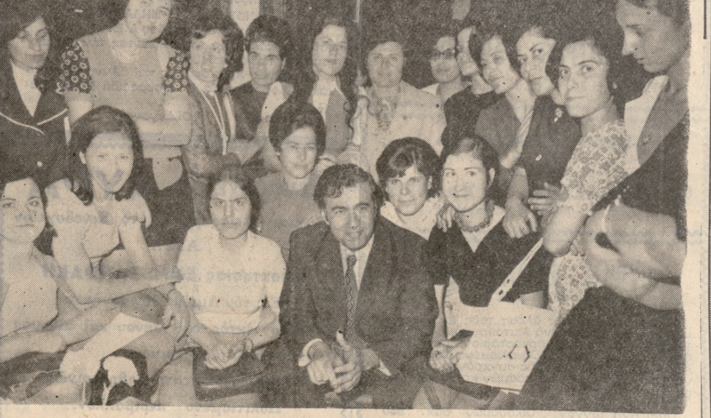
Κατόπιν πρωτοβουλίας τής συζύγου του Ύφυπουργού Π.Δ.Κ. κ. Φούλης Γεωργαλά έδόθη, προχθές τό έσπερας εις τās αίθουσας του Ξενοδοχείου «ΑΣ ΤΟΡΙΑ», δεξίωσις προς τιμήν εργαζομένων γυναικών τού Ηρακλείου. Η κ. Γεωργαλά λόγω άσθενείας δεν ήδυνήθη, παρά τήν μεγάλην έπιθυμίαν της να παρασθί εις τήν δεξίωσιν. Κατόπιν αυτού τήν άνεπλήρωσιν εις τά καθήκοντα τής οικοδεσποίνης ή συζύγου του Νομάρχου Ηρακλείου κ. Αικατερίνη Μασούρου. Εις τήν δεξίωσιν προσήλθεν και ή χαιρέτισεν τās παραστάσας και ο Ύφυπουργός κ. Γεωργαλάς (άνωτέρω φωτογραφία).