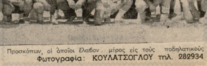
Ενα γκρούπ 'Ανικητέων και άγώνων τής Κυριακής. Προσκόπων, οι όποιοι έλαβον μέρος εις τούς ποδηλατικούς άγώνας τής Κυριακής.