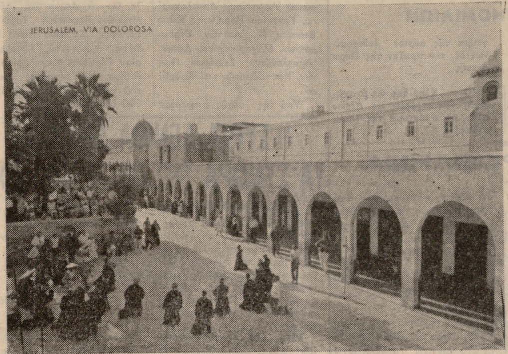
JERUSALEM, VIA DOLOROSA

ματίζεται από τρεις λεπτές μαρμαρίνες κολώνες από κάθε πλευρά. Περίλυπος και δακρύων είχε ακουμπήσει στην άριστη κολώνα και προσήχητο ένδομωχος.