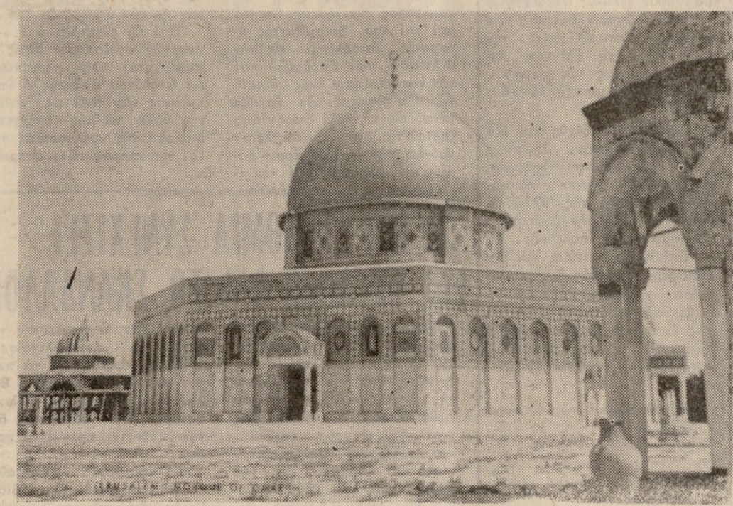
Τὸ Τέμενος Ὁμάρ σπὴ θέσιν τοῦ Ναοῦ τοῦ Σολομῶντος.

τα». Εἰς τὸν ναὸν αὐτὸν ἀφιερώθη ἡ Θεοτόκος καὶ εἰς αὐτὸν ἔγινε ἡ ὑπαπαντὴ τοῦ Κυρίου. Εἰς αὐτὸν εἰσηλθε πρὸ τοῦ πάθους ὁ Ἰησοῦς γενόμενος δεκτός μετὰ βασιῶν καὶ κλάδων. Κατεστράφη ἀπὸ τὸν Τίτον τὸ 70 μ.Χ. Τὸ 638 οἱ Ἀραβεῖς ἔκτισαν τὸ Τέμενος Ὁμάρ, οἱ Σταυροφόροι τὸ μετέβαλαν εἰς χριστιανικὸν καὶ τέλος καθιερώθη ὡς τόπος λατρείας τοῦ Ἰσλάμ, ἐπὶ τουρκικῆς κατοχῆς.