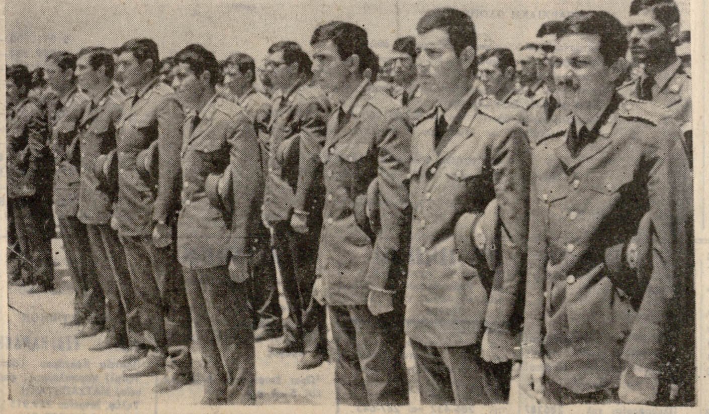
Οι νέοι ΔΕΑ, μαθηταί τής 72Δ ΕΣΣΟ, παρακολουθούν τήν τελετήν άπονομής τών άποφοιτηρίων τών.