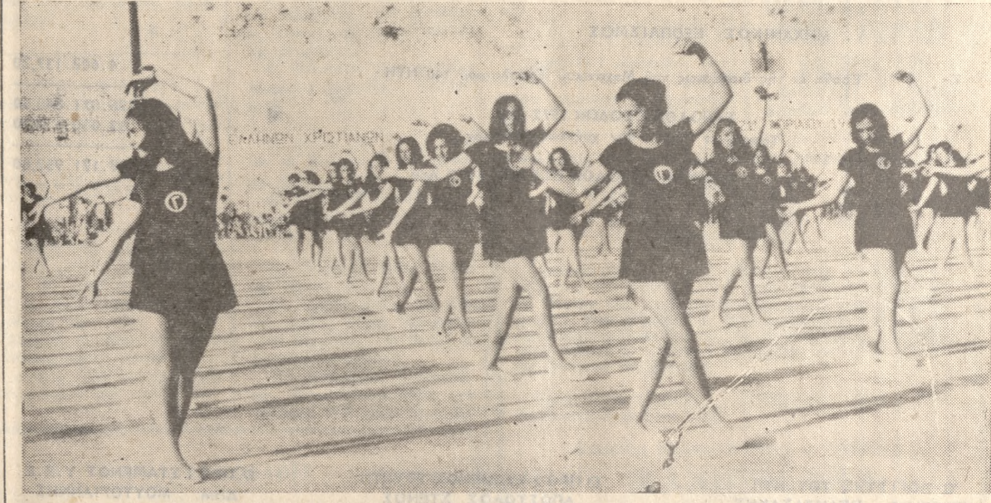
Με άρμονία και χάρη μαθ ήτριες τών Σχολείων Μέσης Έκπαιδύσεως τής πόλεως μας έκτελούν διάφορους άσκήσεις.