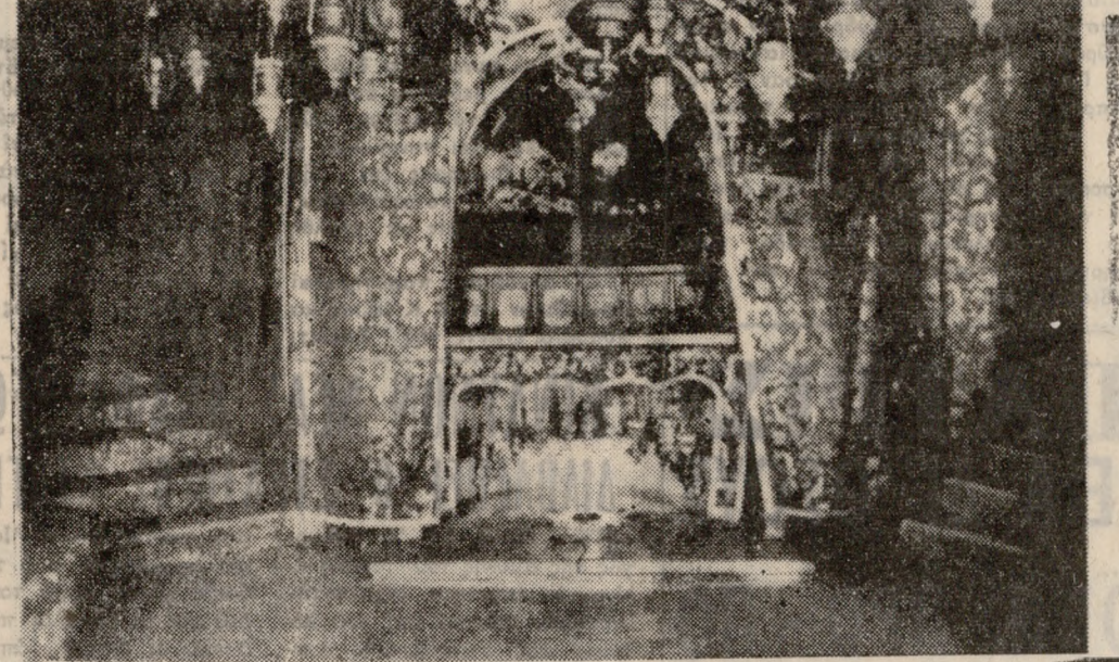
Τὸ ἅγιον Σπῆλαιον. Τὸ σημεῖον τῆς Γεννήσεως σημεῖοῦται μὲ τὸ ἄστρο.

μικρὸ λίκνον. Ὁ γενικός διακόσμος τοῦ Σπηλαίου ἀφίεται ἐξ ἴσου στὰ τρία δόγματα. Οἱ ὄρες ιεροτελεστιῶν τῶν δογμάτων εἶναι αὐστηρὰ καθορισμένες, ὥστε νὰ μὴν ἐπέχεται σύγχισις. Ἀνεβαίνοντας καὶ πάλι στὸ ναὸ, συγκεντρωνόμεσθε, ρίχνομε τίς τελευταῖες ματιές