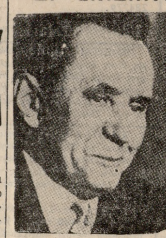
Ο κ. ΚΟΣΥΓΚΙΝ