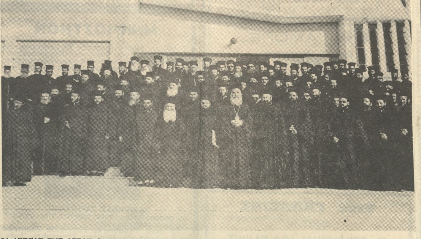
ΟΙ ΙΕΡΕΙΣ ΤΗΣ ΙΕΡΑΣ ΑΡΧΙΕΠΙΣΚΟΠΗΣ ΚΡΗΤΗΣ ΙΟΙ ΟΠΟΙΟΙ ΣΥΜΜΕΤΕΧΟΥΝ ΕΙΣ ΤΟ ΙΕΡΑΤΙΚΟΝ ΣΥΝΕΔΡΙΟΝ ΦΩΤΟΓΡΑΦΟΥΜΕΝΟΙ ΕΞΘΙ ΤΟΥ ΟΙΚΟΤΡΟΦΕΙΟΥ ΕΧΟΝΤΕΣ ΕΙΣ ΤΟ ΜΕΣΟΝ ΤΟΝ ΠΡΟΚΑΘΗ- ΜΕΝΟΝ ΤΗΣ ΕΚΚΛΗΣΙΑΣ ΚΡΗΤΗΣ.