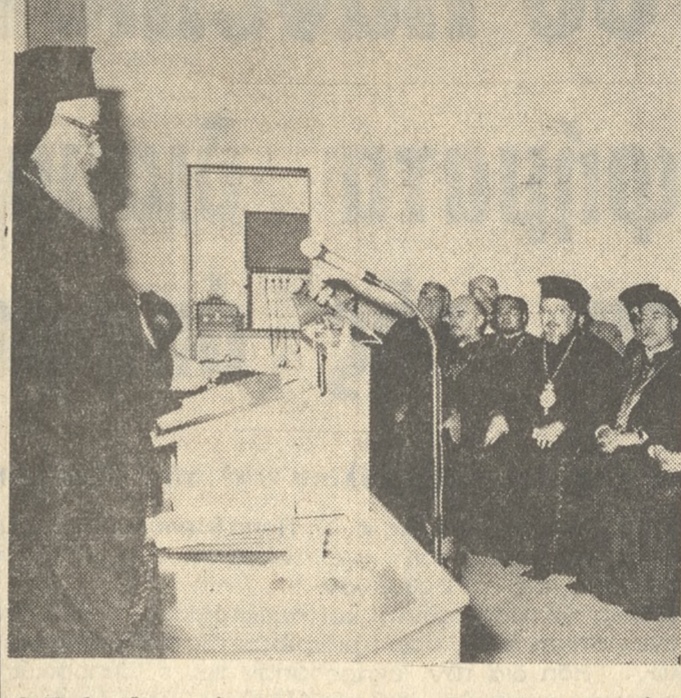
Ο Σεβ. 'Αρχιεπίσκοπος Κρήτης κ. Ευγένιος όμιλών κατά τήν διάρκειαν του Διεθνούς Συνεδρίου, τό όποιον έλαβε χώραν εις τήν 'Ορθόδοξον 'Ακαδημίαν Κρήτης. 'Ός γνωστόν ό "Άγιος Κρήτης παρέστη εις τό Συνέδριον ως εκπρόσωπος τής Α.Θ.Π. του Οικουμενικού Πατριαρχου κ. Δημητρίου.