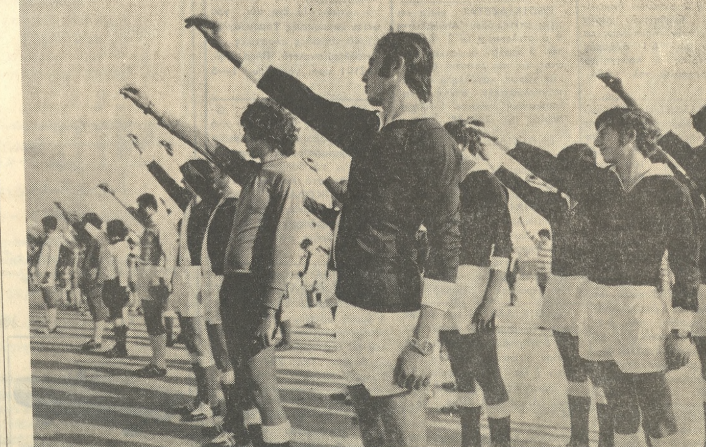
ΜΕ ΥΨΟΜΕΝΗΝ ΤΗΝ ΔΕΞΙΑΝ ΟΙ ΠΟΔΟΣΦΑΙΡΙΣΤΑΙ ΤΩΝ ΣΩΜΑΤΕΙΩΝ ΤΗΣ ΔΥΝΑΜΕΩΣ ΤΗΣ ΕΠΣΗΛ ΔΙΔΟΥΝ ΤΟΝ ΟΡΚΟΝ ΤΟΥ ΑΘΛΗΤΟΥ